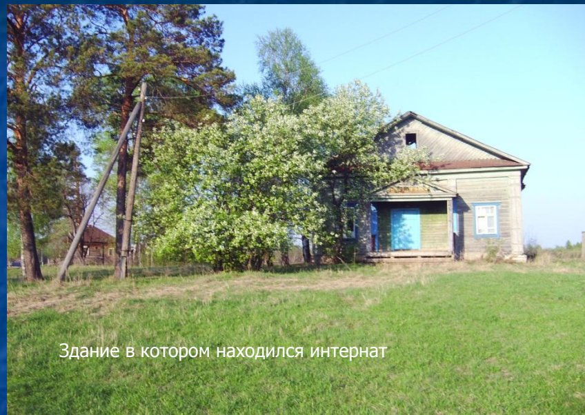
Здание в котором находился интернат