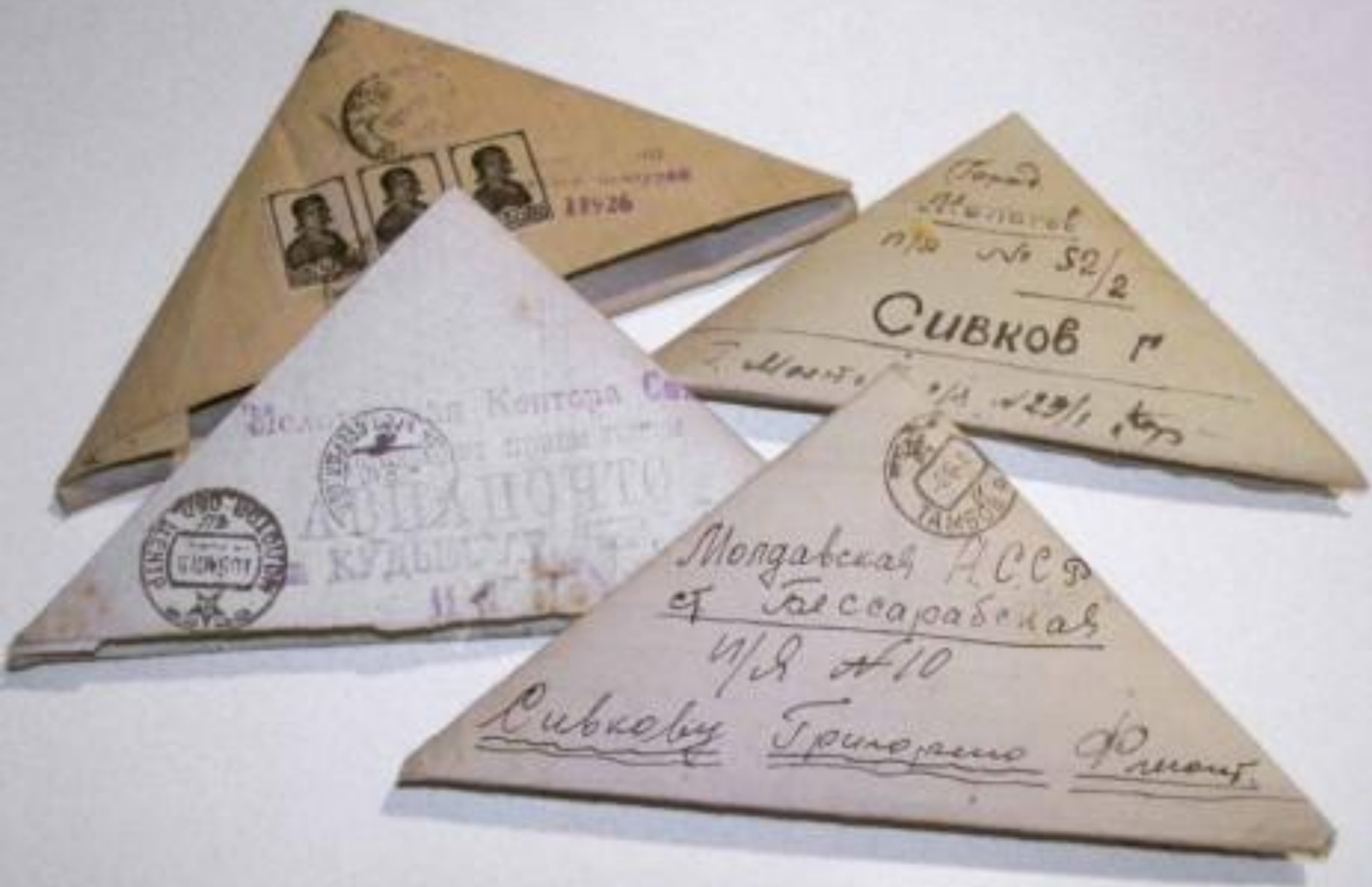
Треугольное письмо реденько бабы получали...