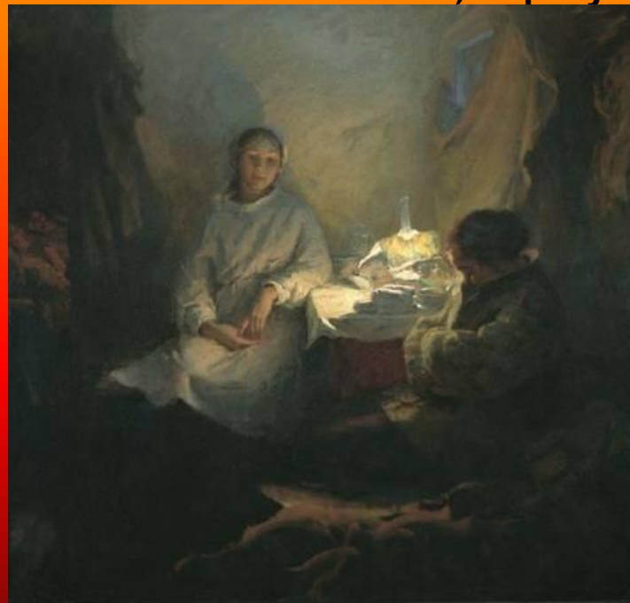
Б. Неменский. Машенька