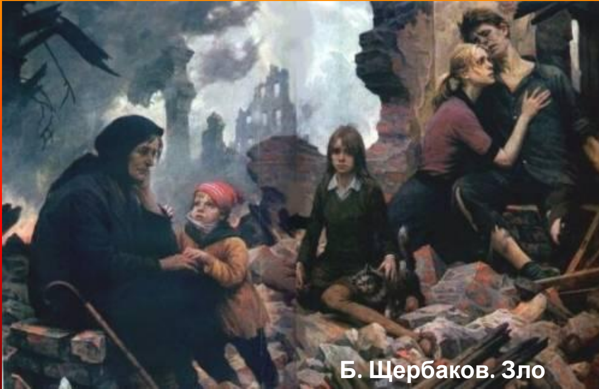
Б. Щербаков. Зло мира.

«Осталась одна пуговица, от маминой кофты. А в печи две булки теплого хлеба».