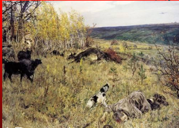
А.Пластов. Фашист пролетел