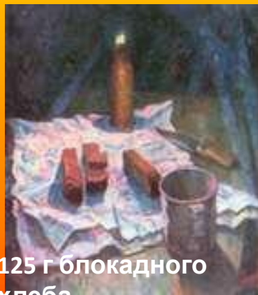
125 г блокадного хлеба