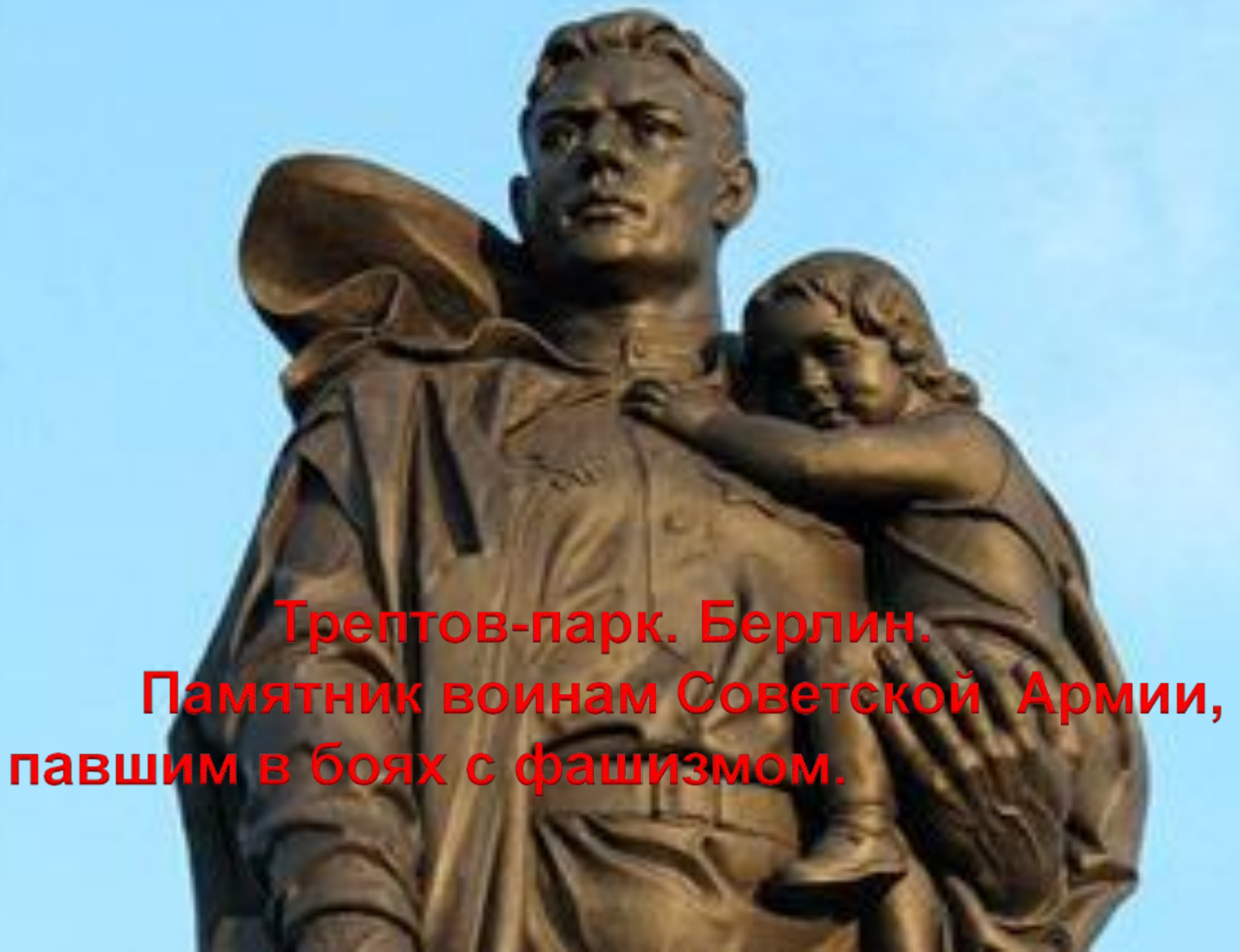
Трептов-парк. Берлин. Памятник воинам Советской Армии, павшим в боях с фашизмом.