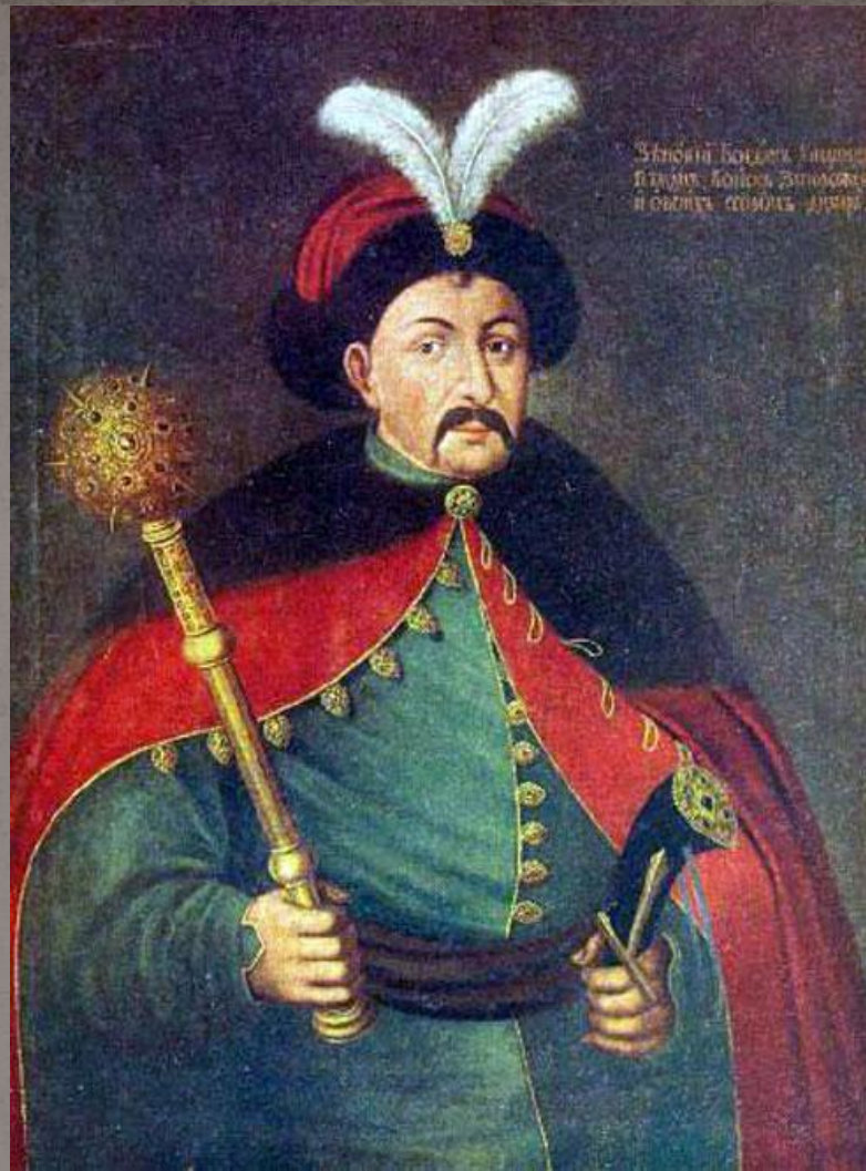
Б. Хмельницький Правління: 1648-1657 рр.