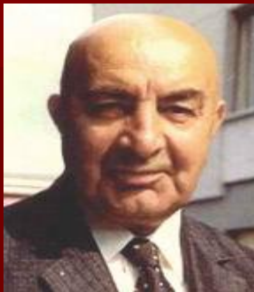
Мухаммед Дауд Хан

Двоюродный брат короля. 27 апреля 1978г. Дауд был свергнут в результате военного путча, проведенного фракциями коммунистической партии, объединившимися под названием «Народно-Демократическая Партия Афганистана».