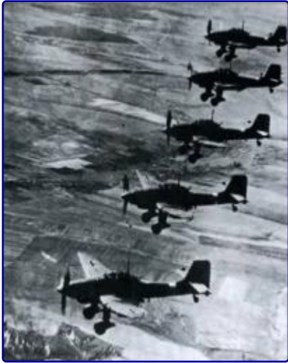
22 июня 1941 года. Немецкие бомбардировщики над советской территорией