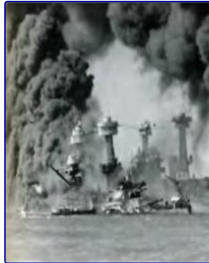
7 декабря 1941 года. После нападения на Пёрл-Харбор