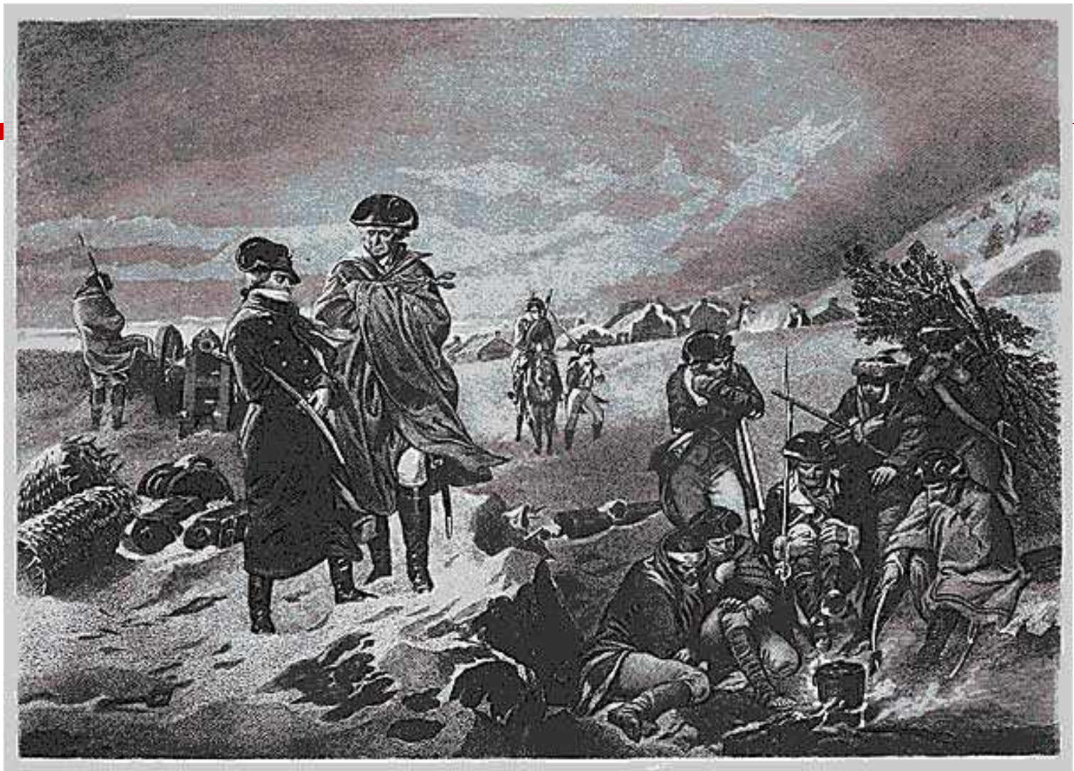
Вашингтон и Лафайет