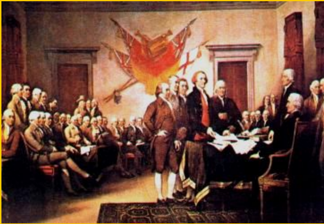
Принятие «Декларации независимости» 4 июля 1776 год