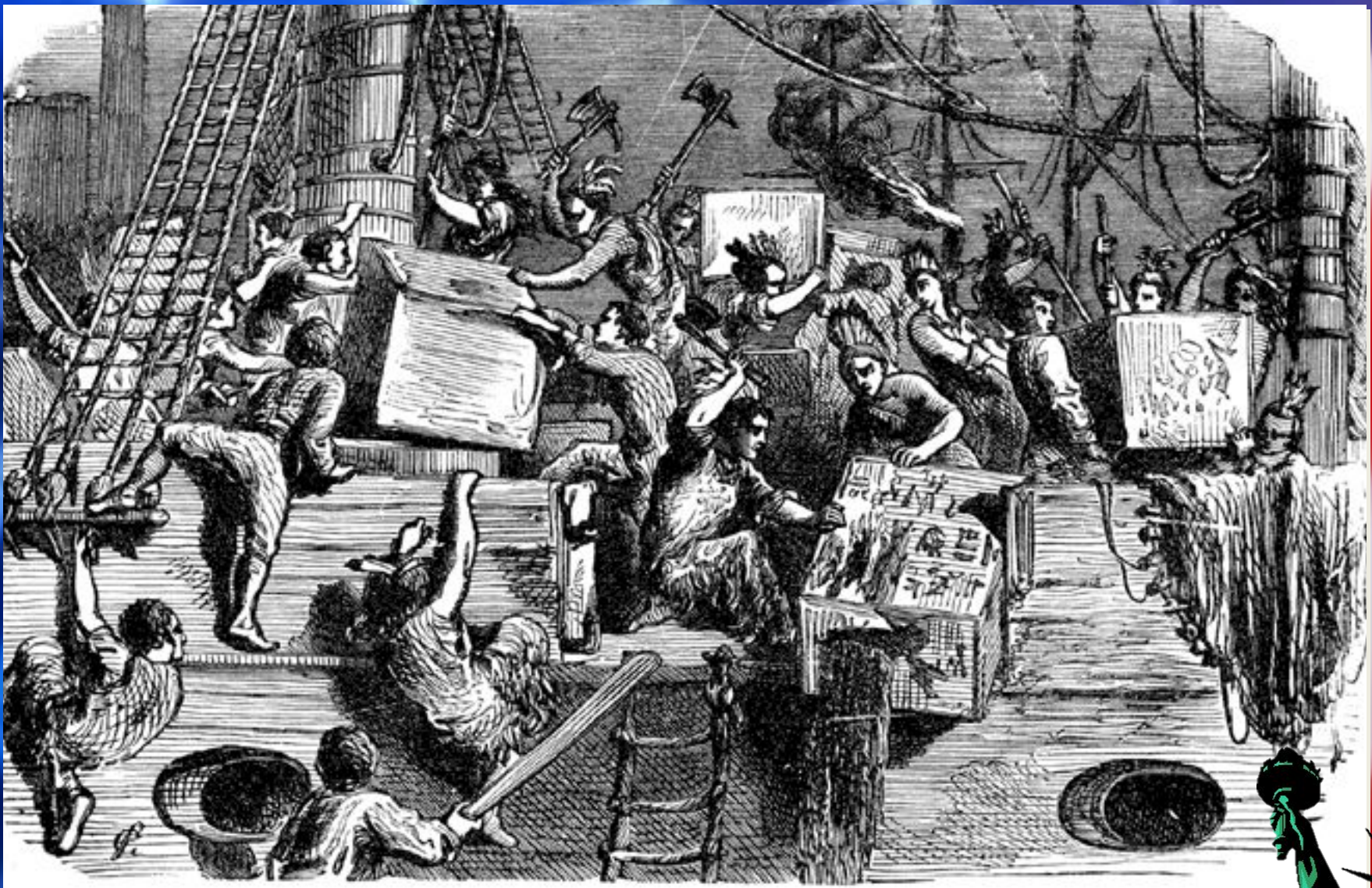
Бостонское чаепитие 1773 г.