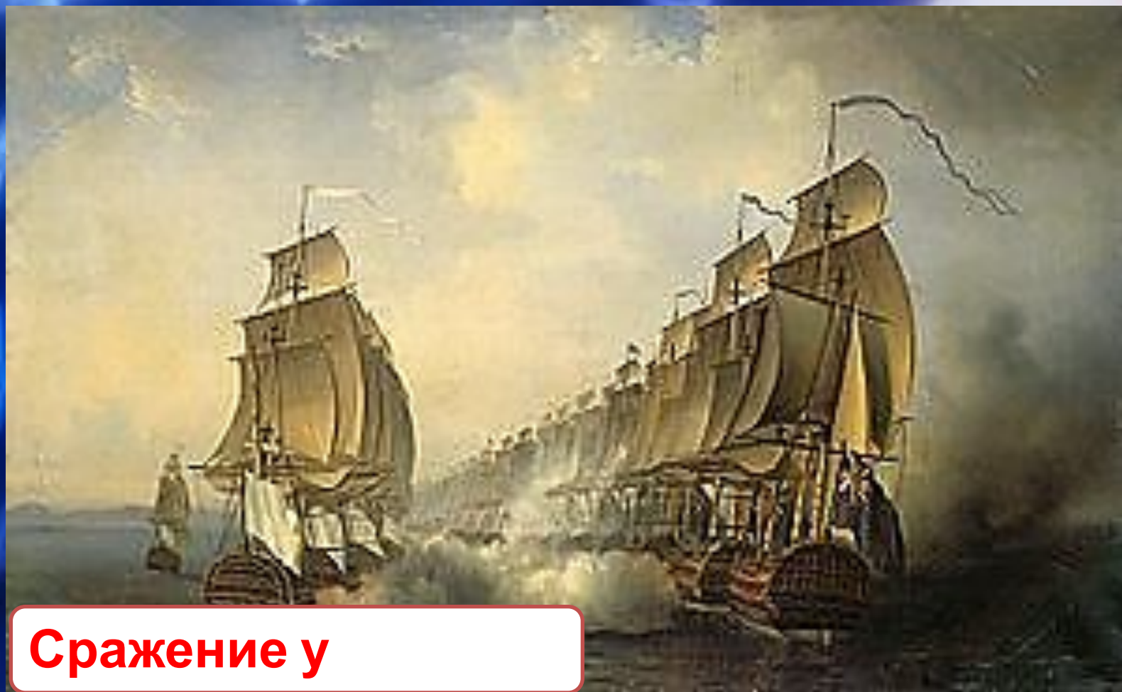
Сражение у Куддалора

Конец 1781—1782 годов — произошли несколько морских сражений и ряд мелких столкновений на суше. 20 июня 1783 года — Сражение у Куддалора — последнее сражение войны США за независимость