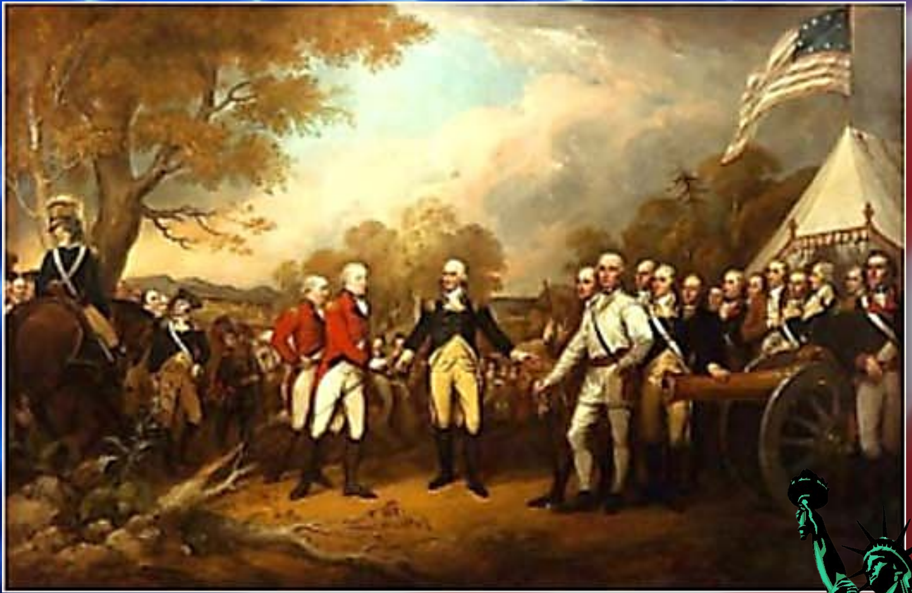
Битва при Саратоге