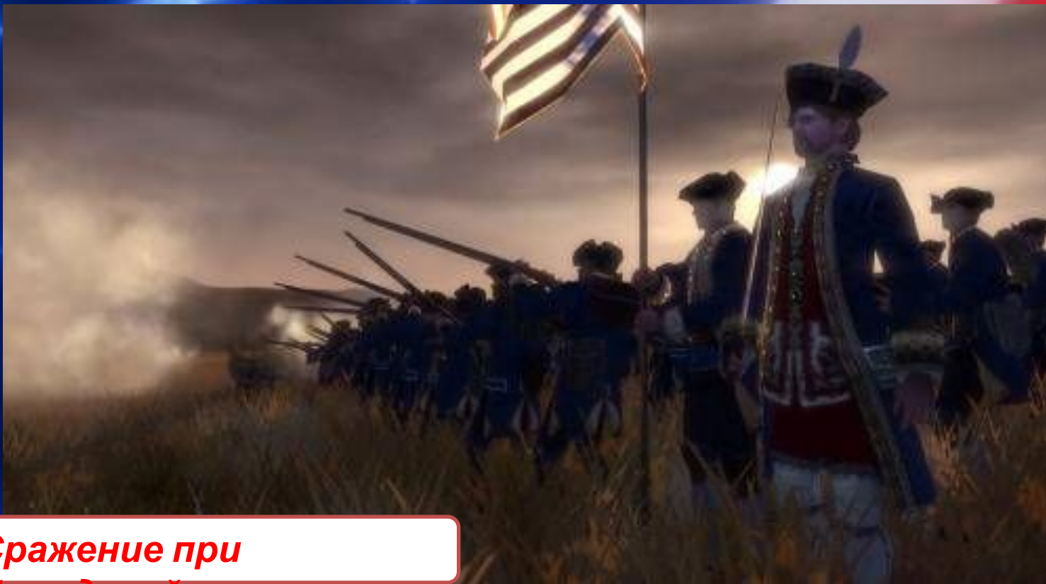
Сражение при Брендивайне

Весной 1776 года Король направил для подавления восстания флот с десантом из гессенских наёмников. Британские войска перешли в наступление. В 1776 году британцы заняли Нью-Йорк, а в 1777 году, в результате сражения при Брендивайне , Филадельфию. На фоне эскалации насилия 4 июля 1776 года депутаты колоний приняли декларацию независимости и образования США. В битве при Саратоге американские сепаратисты впервые одержали победу над королевскими войсками.