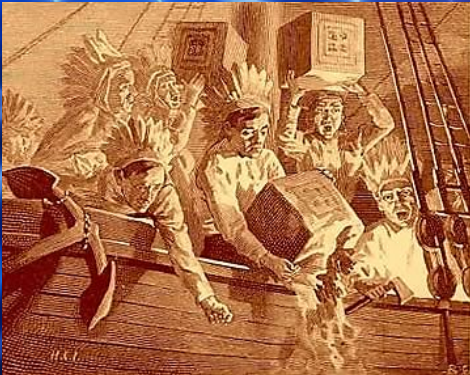
Бостонское чаепитие 1773 г.