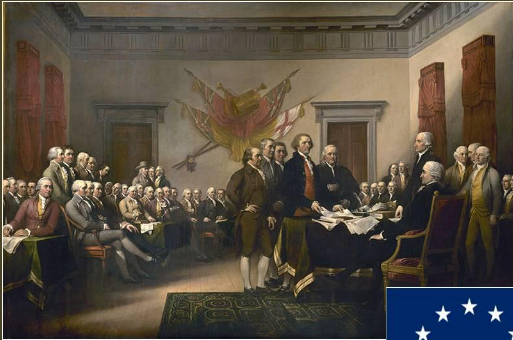
Подписание Декларации независимости картина Джона Трамбулла

Первый Президент США Джордж Вашингтон говорил о флаге США: Звезды мы взяли с небес, красный цвет — цвет нашей родины, белые полосы, которые его разделяют, означают, что мы отделились от неё; эти белые полосы войдут в историю как символ свободы.