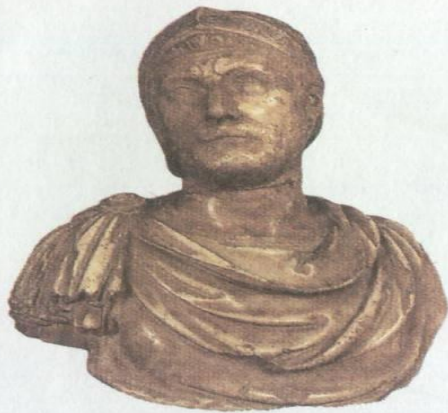
Ганнибал. Древняя скульптура