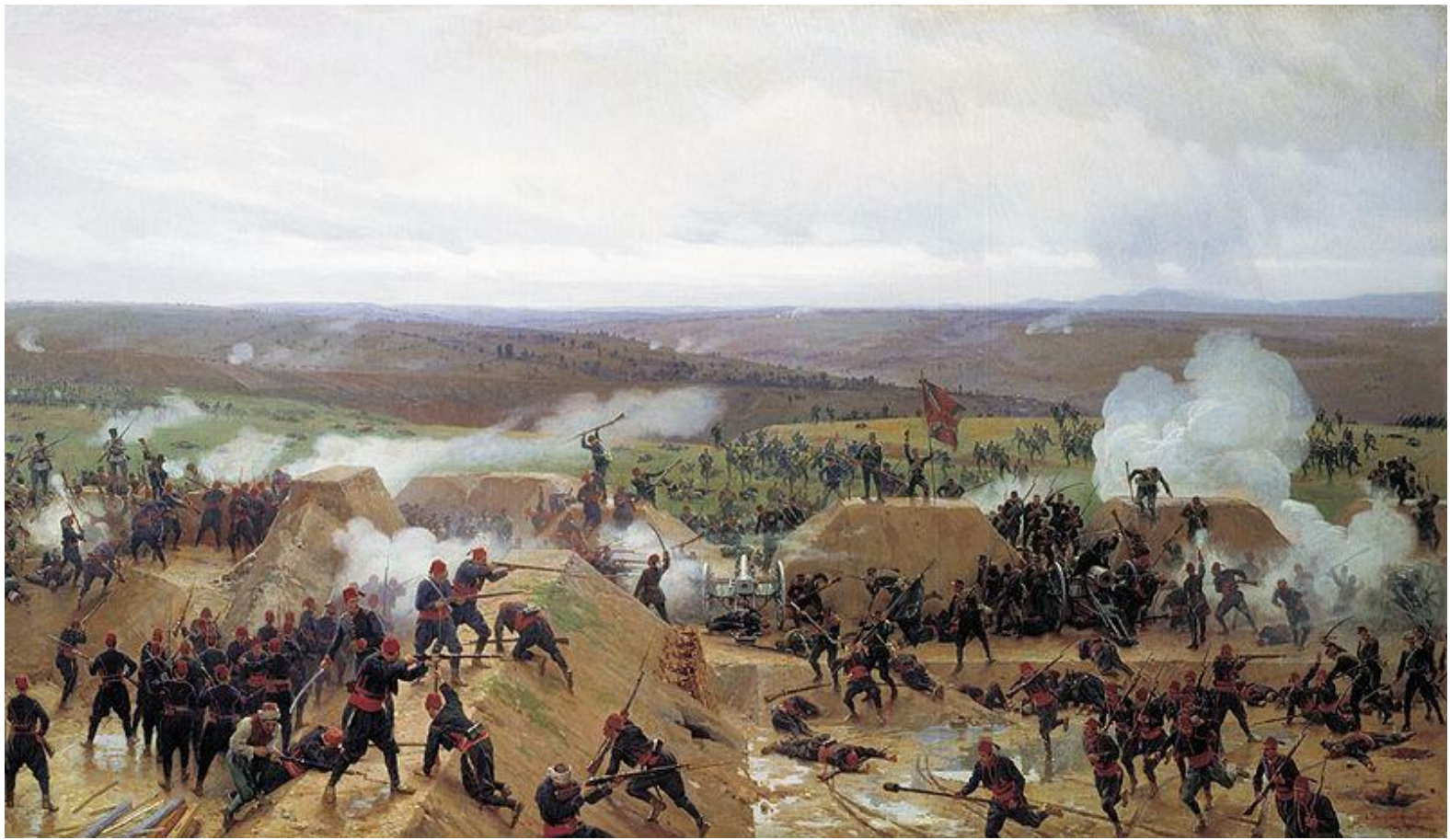
ЗАХВАТ ГРИВИЦКОГО РЕДУТА ПОД ПЛЕВНОЙ