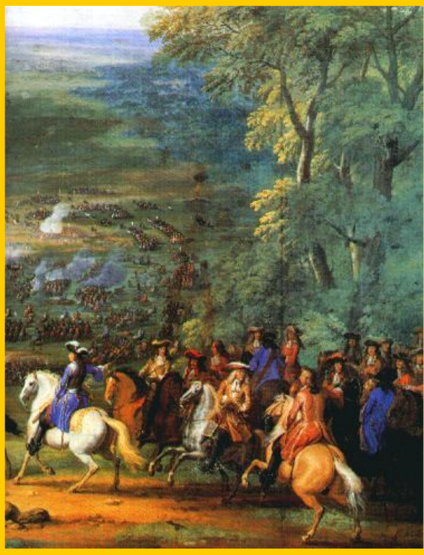
Принц Конде в битве при Рокруа.

Вскоре в Германию вторглись шведы и в 1632 г. Густав Адольф II разбил католиков, но сам погиб. В 1634 г. Валленштейн был убит заговорщиками. Вскоре в войну вмешалась Франция. Ришелье оказал немецким князьям финансовую помощь. В 1642-46 гг. союзники одержали ряд побед над австрийцами и испанцами и 24 октября 1648 г. в Мюнстере был подписан Вестфальский мир.