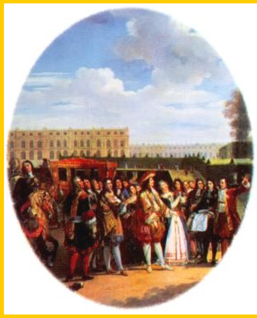
Людовик XIV осматривает Версаль

По окончании войны самыми могущественными государствами стали Швеция и Франция. Французскому королю подражали все европейские монархи. Версаль стал образцом дворцово-паркового зодчества.