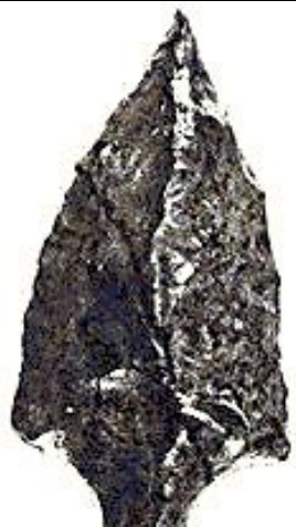
Каменный наконечник с ножкой. Сев. Африка

С возникновения человека (св. 2 млн. лет назад) примерно до 10-го тыс. до н. э.