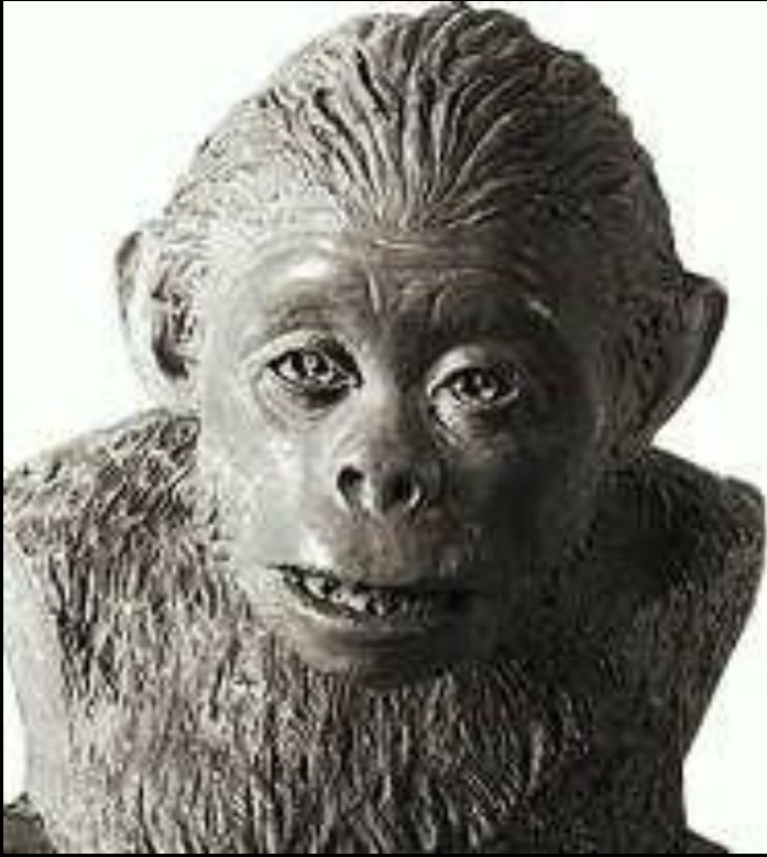
Детеныш австралопитека. Реконструкция М. М. Герасимова..