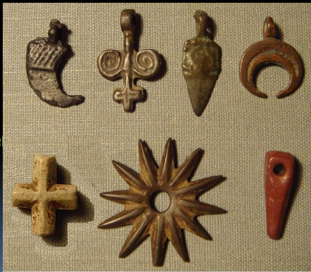
Городище Дубна. Амулеты, нательный крест и колесико от шпоры. XII-XIII вв.

В этот период первобытное земледельческое общество достигло своего наивысшего расцвета.