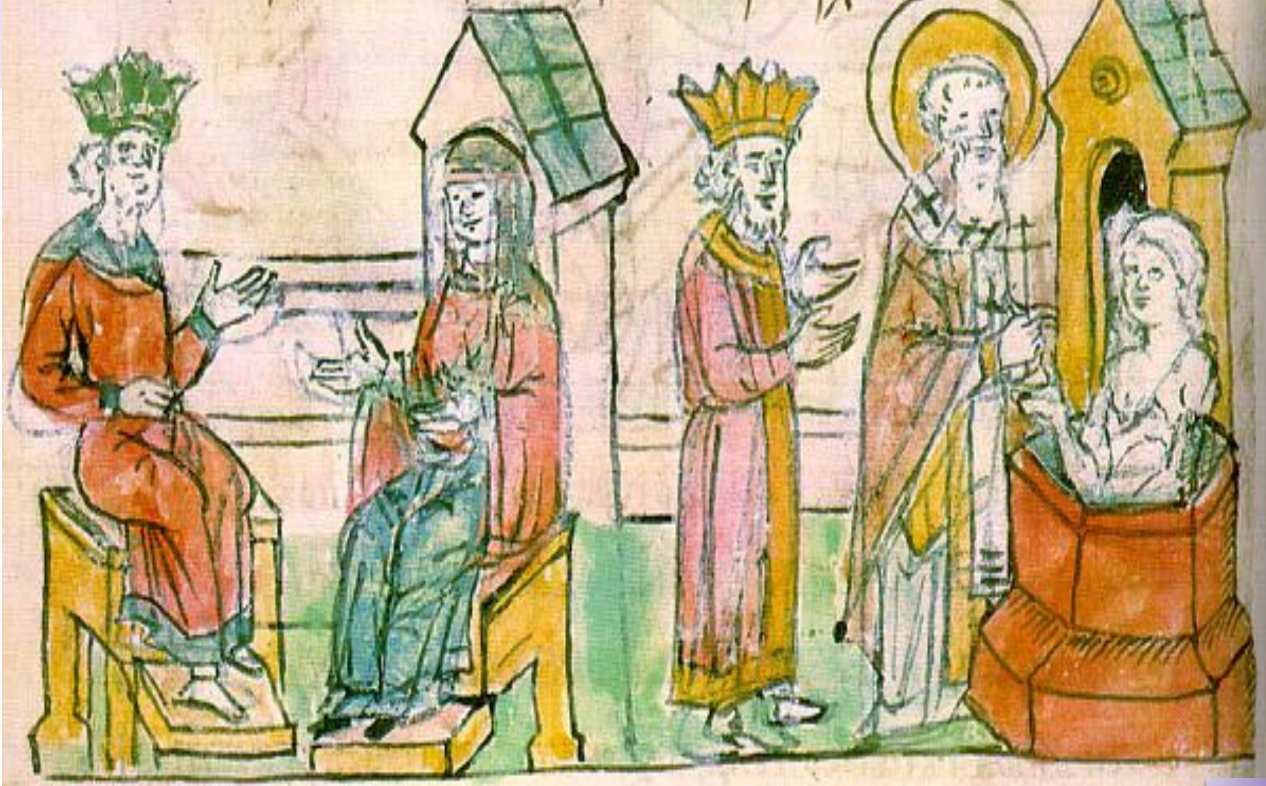
Крещение Ольги в Царьграде