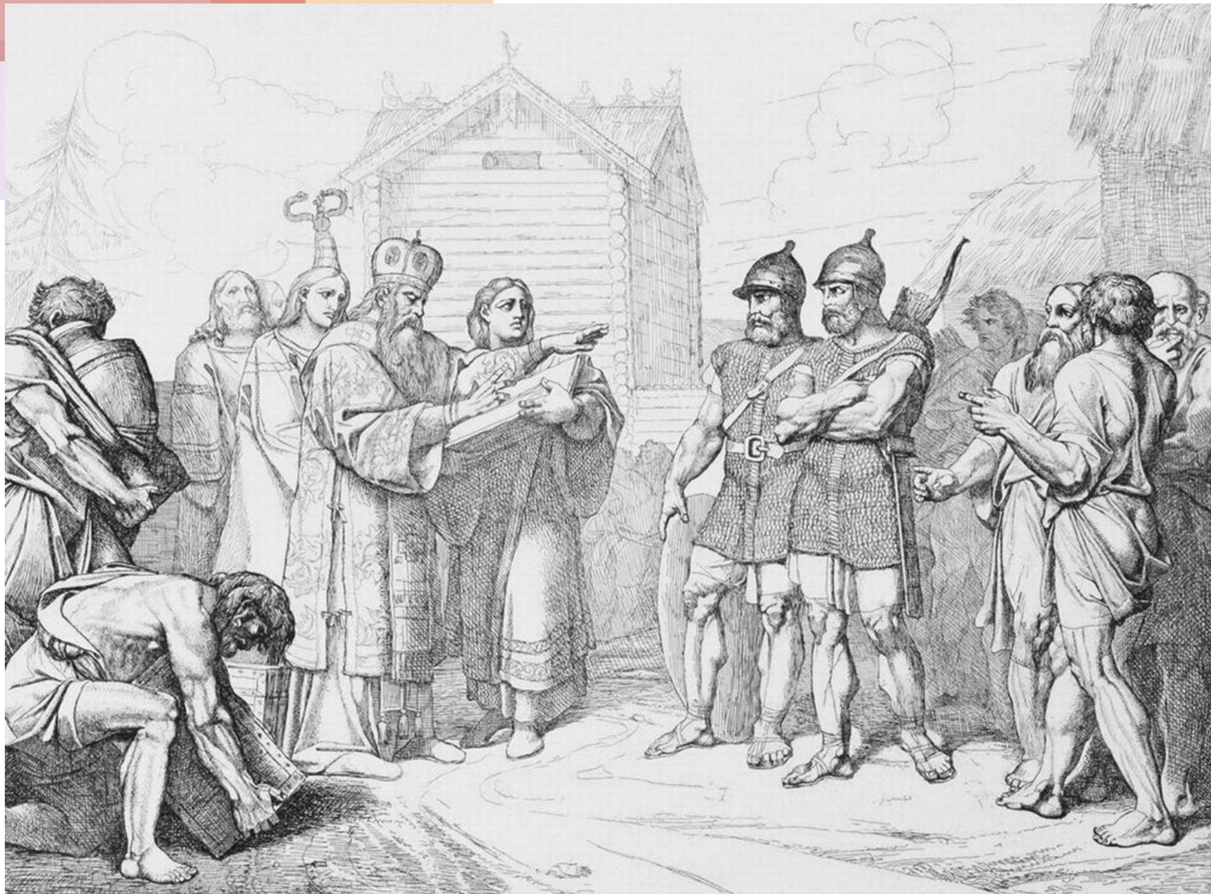
Прибытие в Киев епископа. Гравюра Ф.А. Бруни, 1839