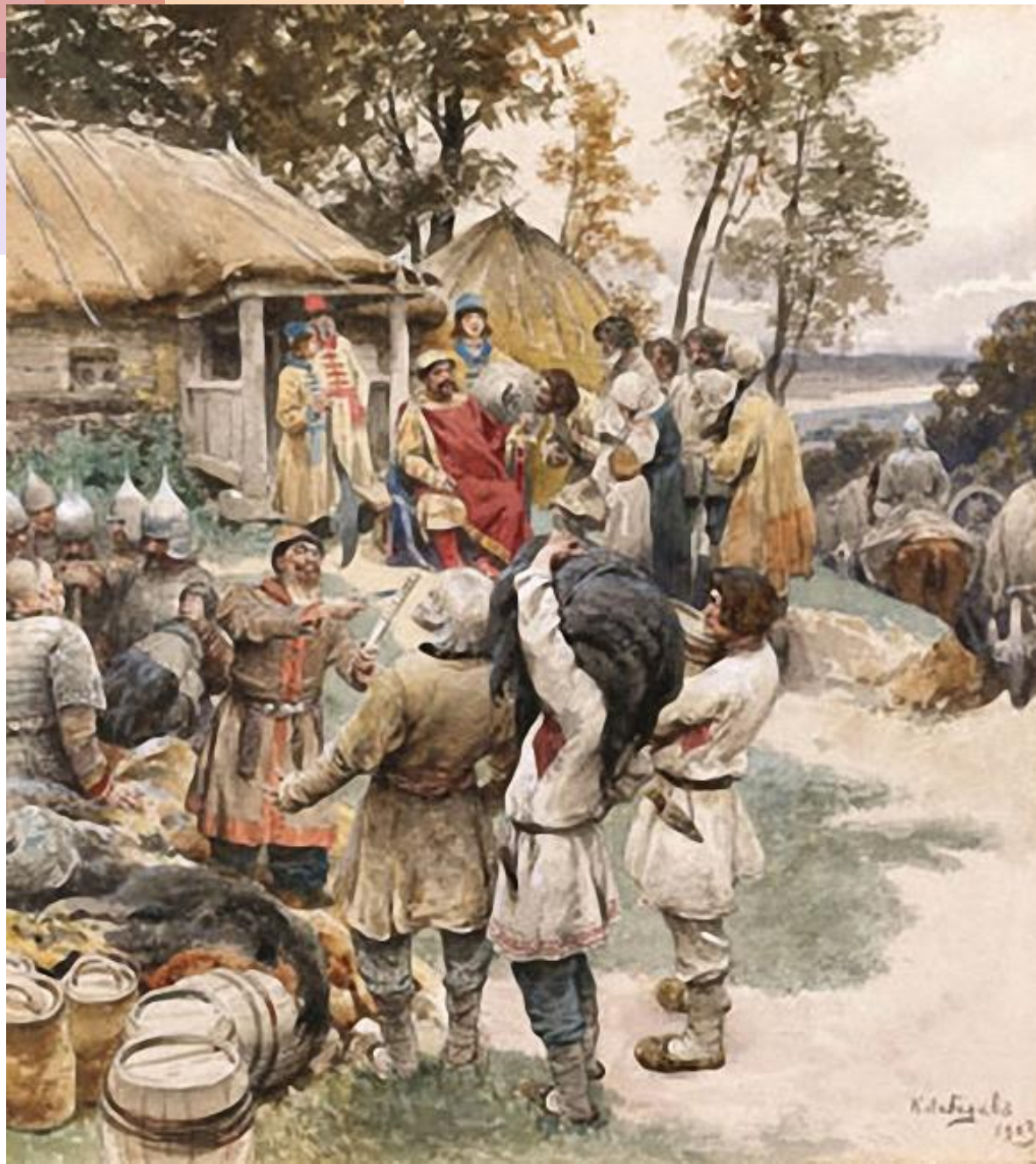
Князь Игорь собирает дань с дrevлян в 945. Художник К. В. Лебедев