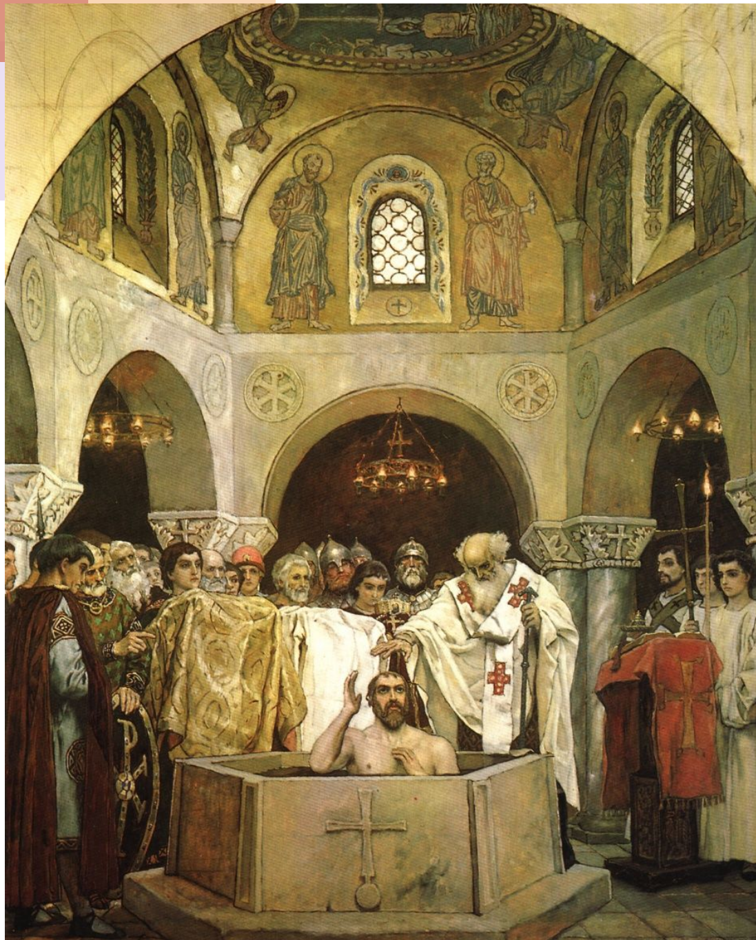
Фреска «Крещение князя Владимира». В. М. Васнецов