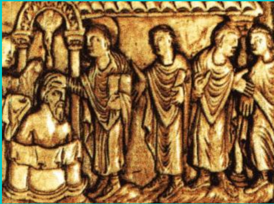
Крещение Хлодвига. Древний барельеф.

Хлодвиг был умным политиком,-он понимал, что одной силы мало для того, чтобы держать население в покорности.