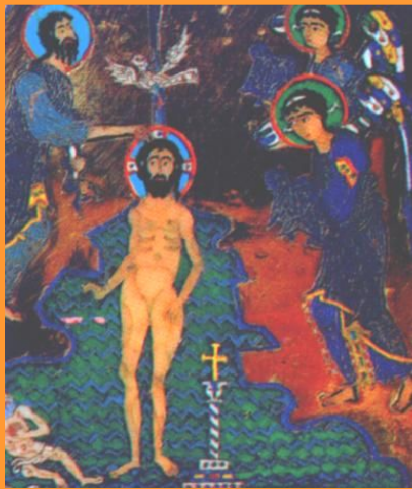
Иоанн Креститель. Миниатюра из византийской рукописи.

Одной из мировых религий(т.е.распространенных во многих странах) является Христианство.