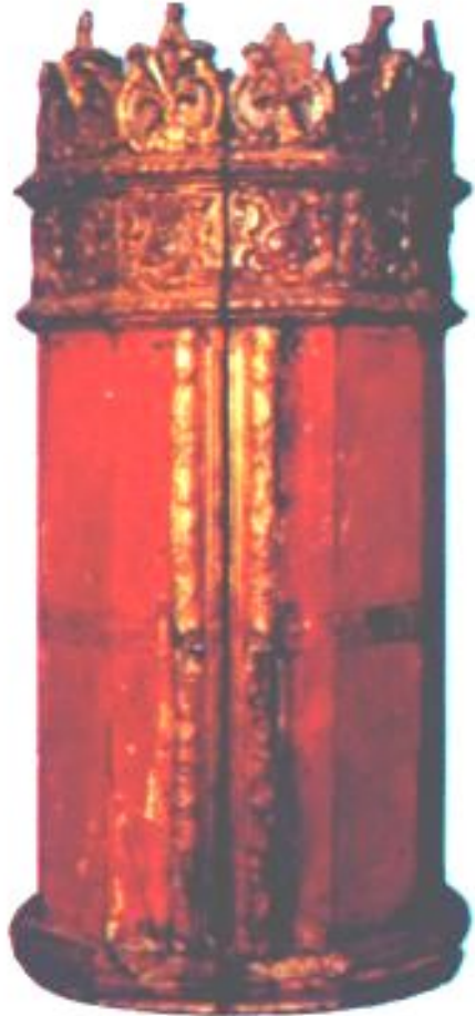
Футляр с Торой

Христос и его первые почитатели были евреями. Среди Еврейского народа в 1 в. до н.э. Распространилось множество различных религиозных сект. Все они почитали священную книгу Древних иудеев-Тору. Среди сект стали появляться слухи о скором установлении царства божьего на Земле.