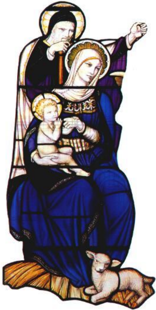
Святое семейство. Современный витраж.

Ок.5г.до н.э. В Палестине родился мальчик, став- ший впоследствии из- вестным под именем Иисуса Христа.