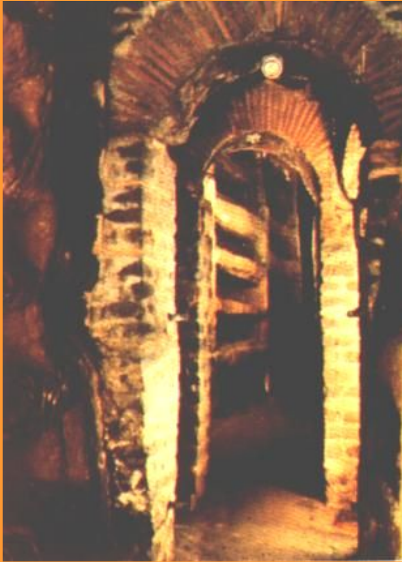
Катакомбы в римских предместьях.

В к.1 в. христианство стало распространяться среди других народов.