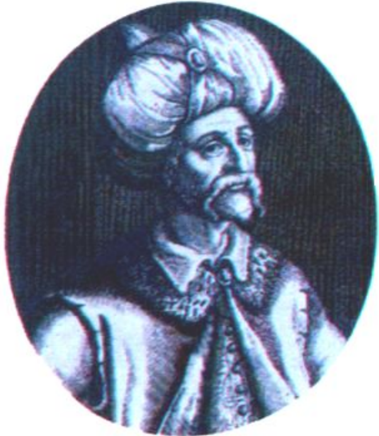
Пророк Мухаммед. Французская гравюра 17 в.

В к.6 в. Аравия потеряла ряд территорий-торговля была нарушена.