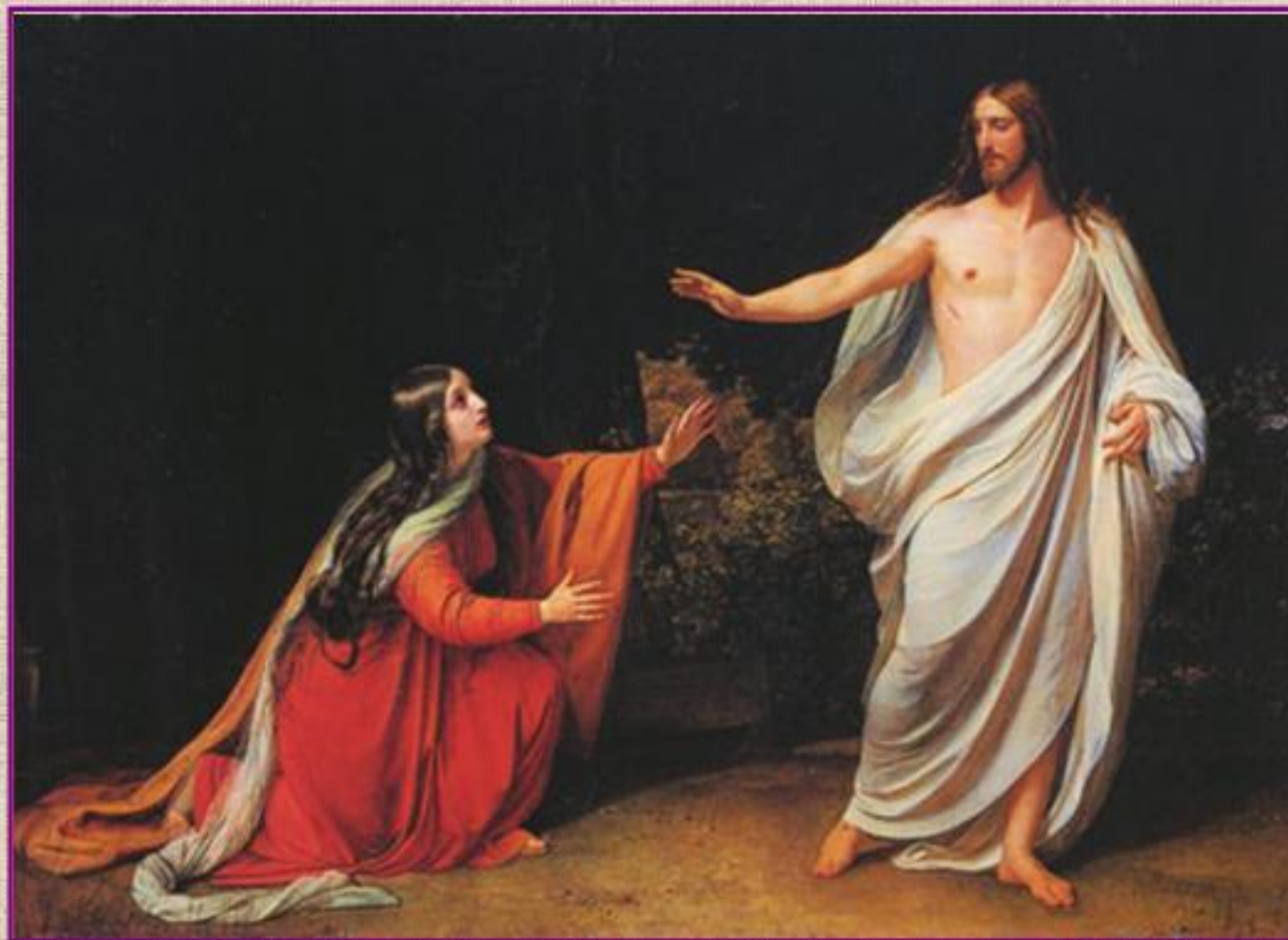
А. Иванов Явление Христа Марии Магдалине после Воскресения. 1835

Иисус, воскресший из мертвых, являлся многим людям. Все радовались и кланялись Ему и верили в Его воскресение.