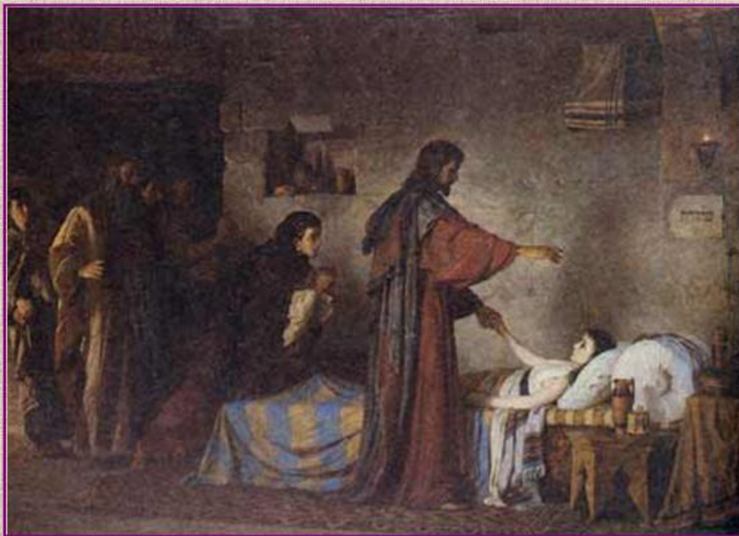
В. Поленов. Воскрешение дочери Иаира. 1871

На картине Иисус Христос воскрешает девочку.