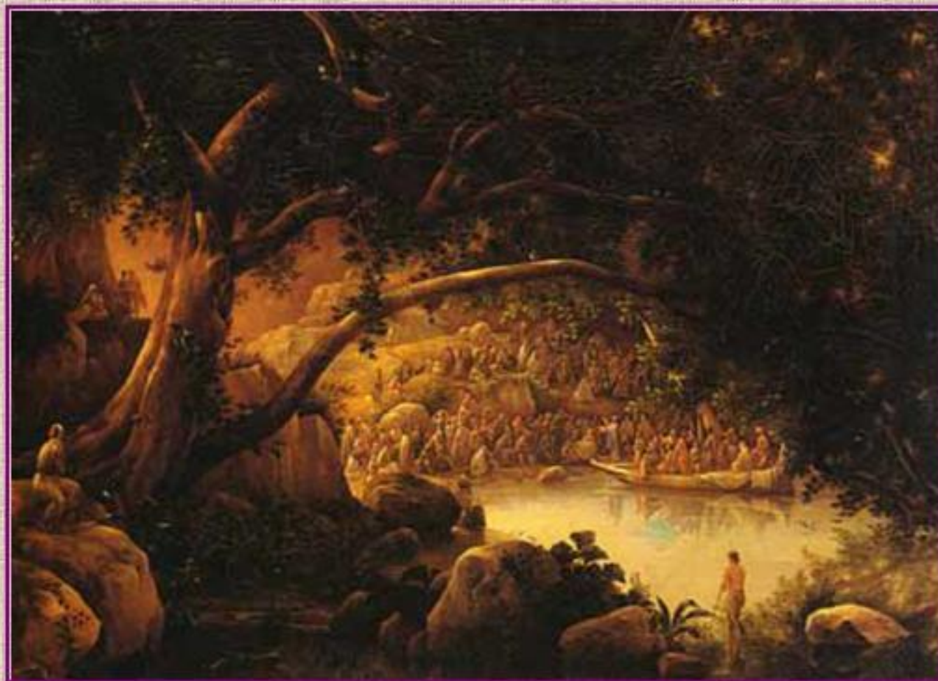
Г. Чернцов, Проповедь Христа на Геннисаретском озере. 1852

Христос учил людей любить Бога, любить родителей, любить всех людей, помогать бедным, слабым. Он хотел, чтобы люди совершали только хорошие дела, всех прощали и не осуждали других. Люди собирались и слушали то, что рассказывал Иисус.