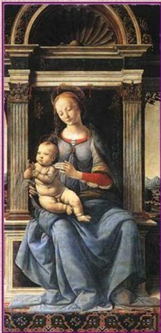
А. Вероккио, 1483. Мадонна с ребенком

Это тоже изображения Богоматери Девы Марии и Младенца Иисуса.