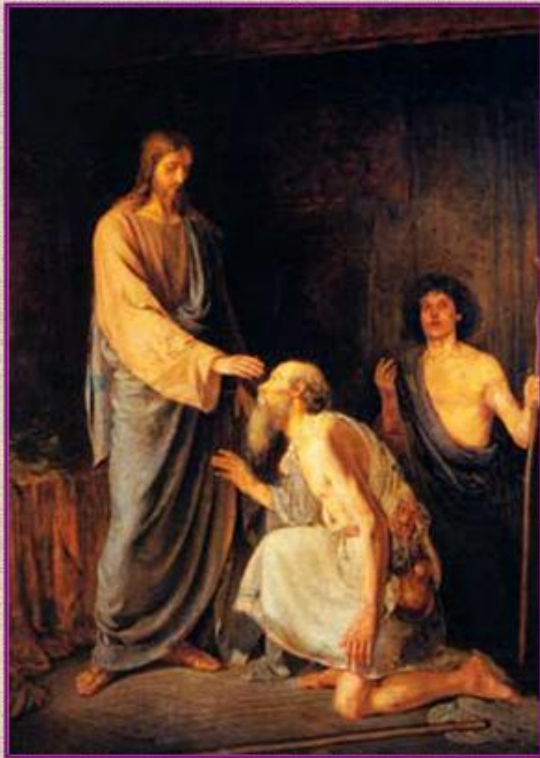
А. Рябушкин. Исцеление двух слепых 1888 г.

Чтобы люди верили Иисусу он совершал много чудес. Превращал воду в сладкое вино, исцелял больных людей.