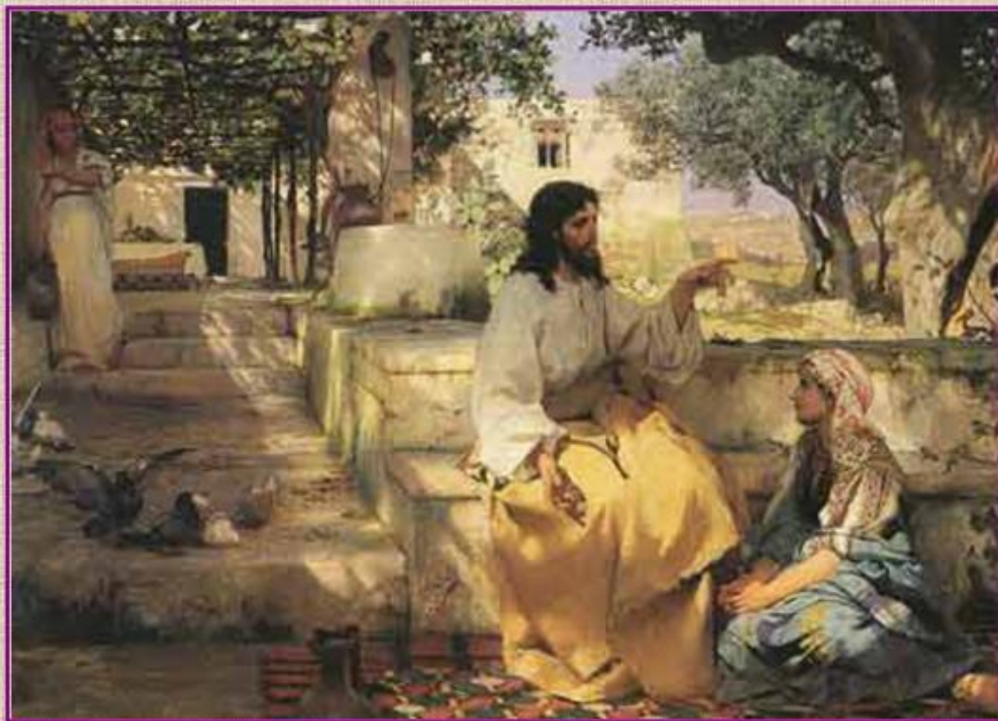
Г. Семирадский. Христос у Марфы и Марии. 1886

Он рассказывал людям небольшие, понятные всем рассказы, которые назывались притчи.