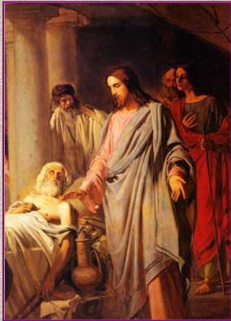
Н. Бруни. 1885 г. Исцеление расслабленного