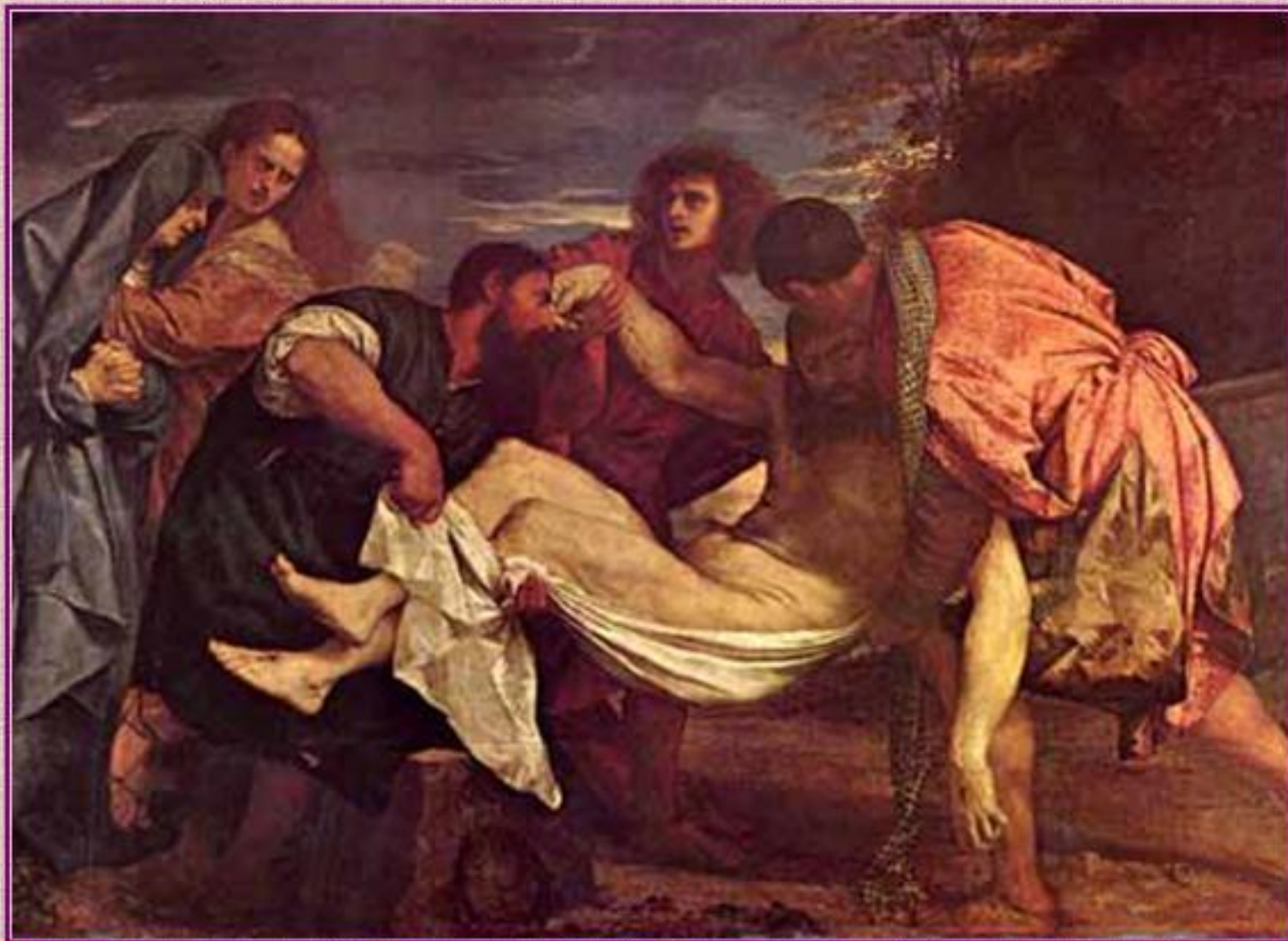
Тициан. Положение во гроб. 1525 г.

Иисус страдал и мучался, умирая на кресте. А затем, тело Его сняли с креста, завернули в ткань и положили в пещере.