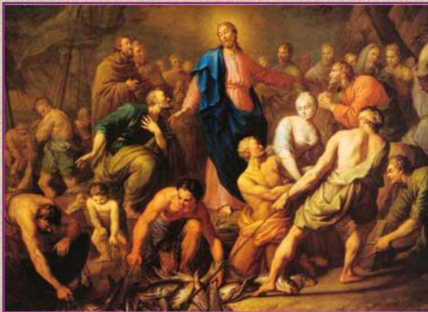
А. Лосенко. Чудесный улов рыбы, 1762

Удивлялись люди чудесам Иисуса Христа и верили в то, что Он Сын Бога, а некоторые стали Его учениками. На картине изображено как было поймано очень много рыбы.