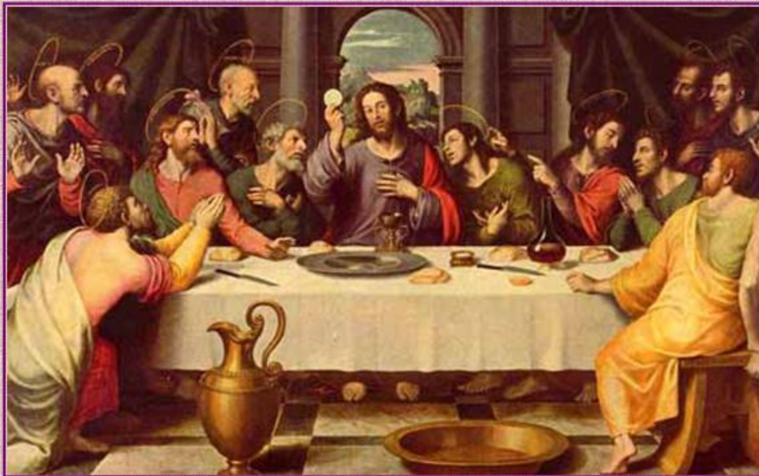
Хуан де Хуанес. Тайная вечеря. 1575-99 гг.

Было у Иисуса Христа двенадцать учеников- апостолов и собрались они вместе. Один из них - Иуда Искариотский, предал своего Учителя, отдав его воинам.