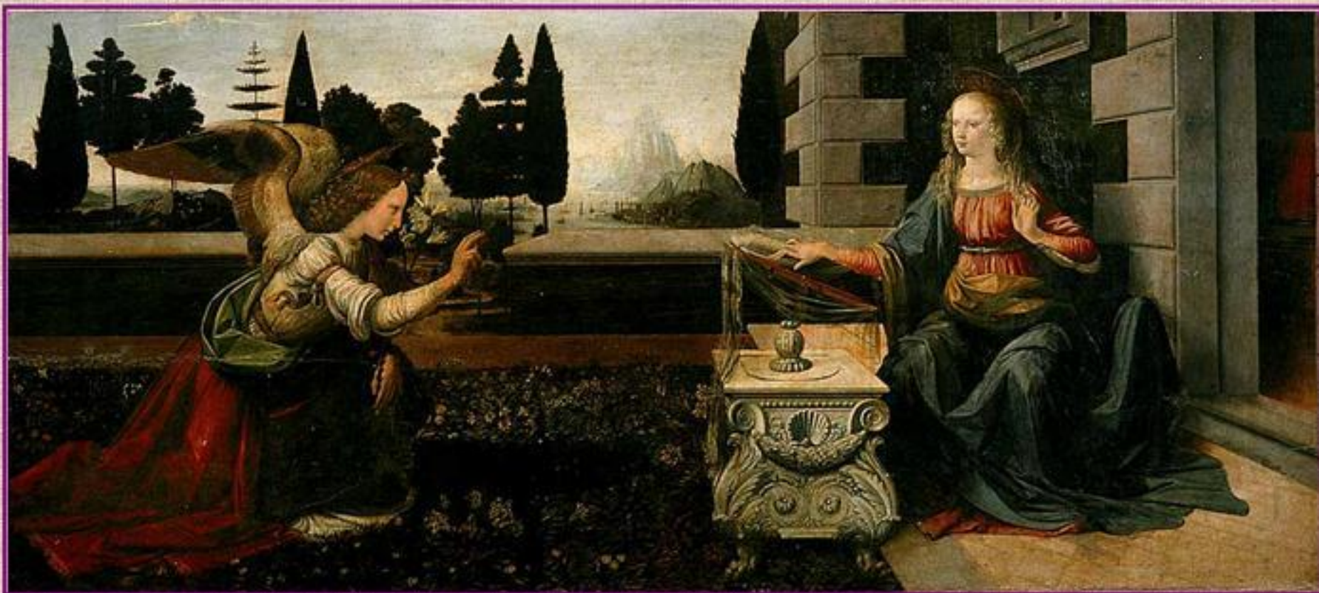
Благовещение. Леонардо да Винчи 1452-1519

Вдруг, однажды, прилетел к ней Архангел и сказал Марии, что у Нее родится Сын, и будут звать Его Иисус. И будет Он Сын Бога. С тех пор это событие называют «Благовещение» и отмечают такой праздник.