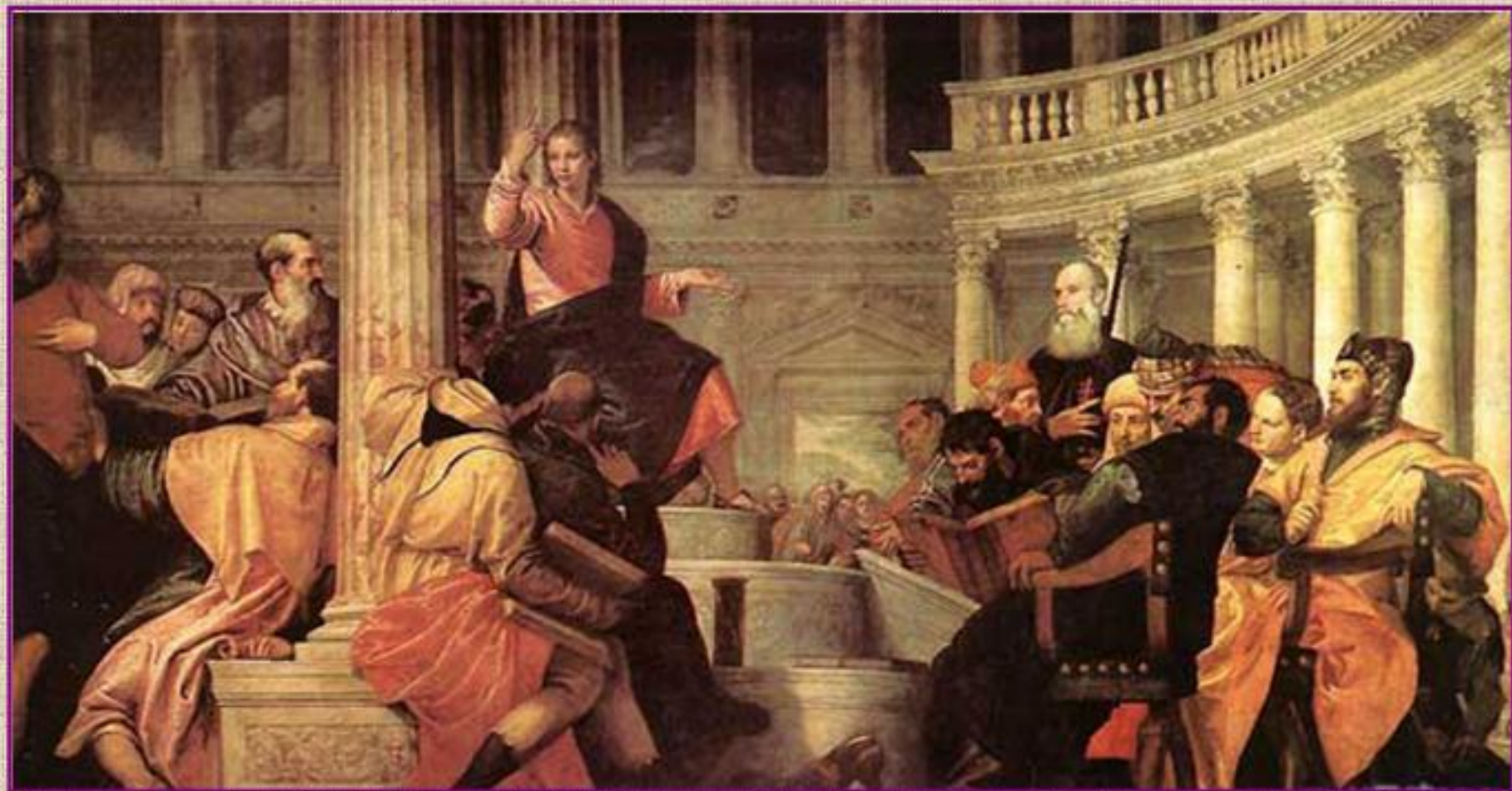
Паоло Веронезе. Иисус среди мудрецов в Храме. 1558 г.

Через некоторое время Иосиф, Мария и мальчик Иисус вернулись из Египта и жили в городе, который назывался Назарет. Иисус слушался родителей, но однажды потерялся. Мария нашла Его в Храме, где он разговаривал с мудрецами.