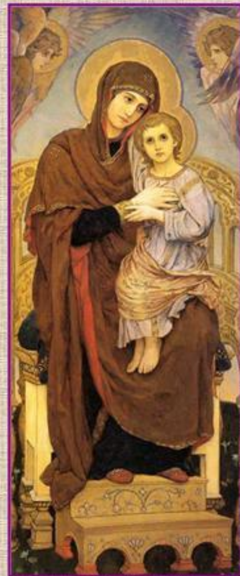
В. Васнецов. 1901 г. Богоматерь с младенцем.

Это тоже изображения Богоматери Девы Марии и Младенца Иисуса.