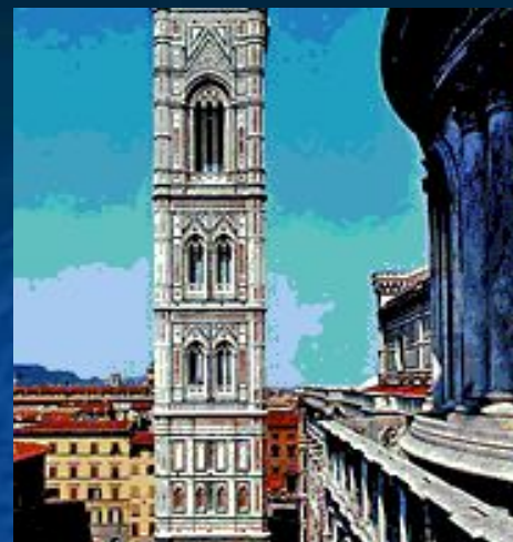
Кампанила собора Санта-Мария дель Фьоре во Флоренции. Построена в 1334-1359 гг.

БОТТИЧЕЛЛИ (Botticelli) Сандро (наст. Алессандро Филипепи, Filiperi) (1445-1510), итальянский живописец. Представитель Раннего Возрождения. Был близок ко двору Медичи и гуманистическим кругам Флоренции.