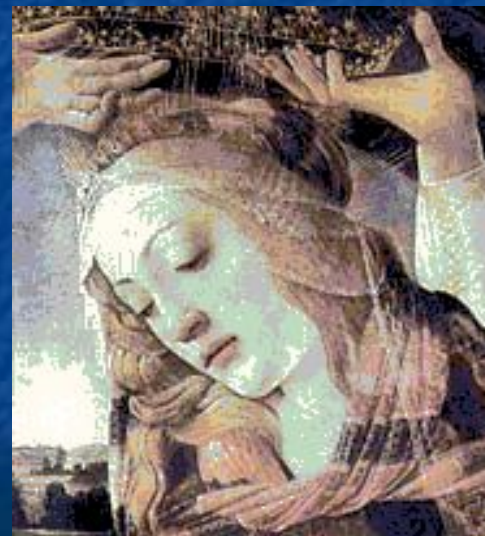
Сандро Боттичелли. Голова Мадонны. Фрагмент.