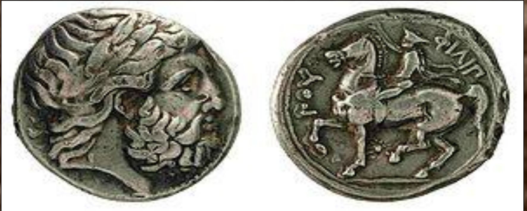
Серебряная тетрадрахма Филиппа II из музея в Фессалониках