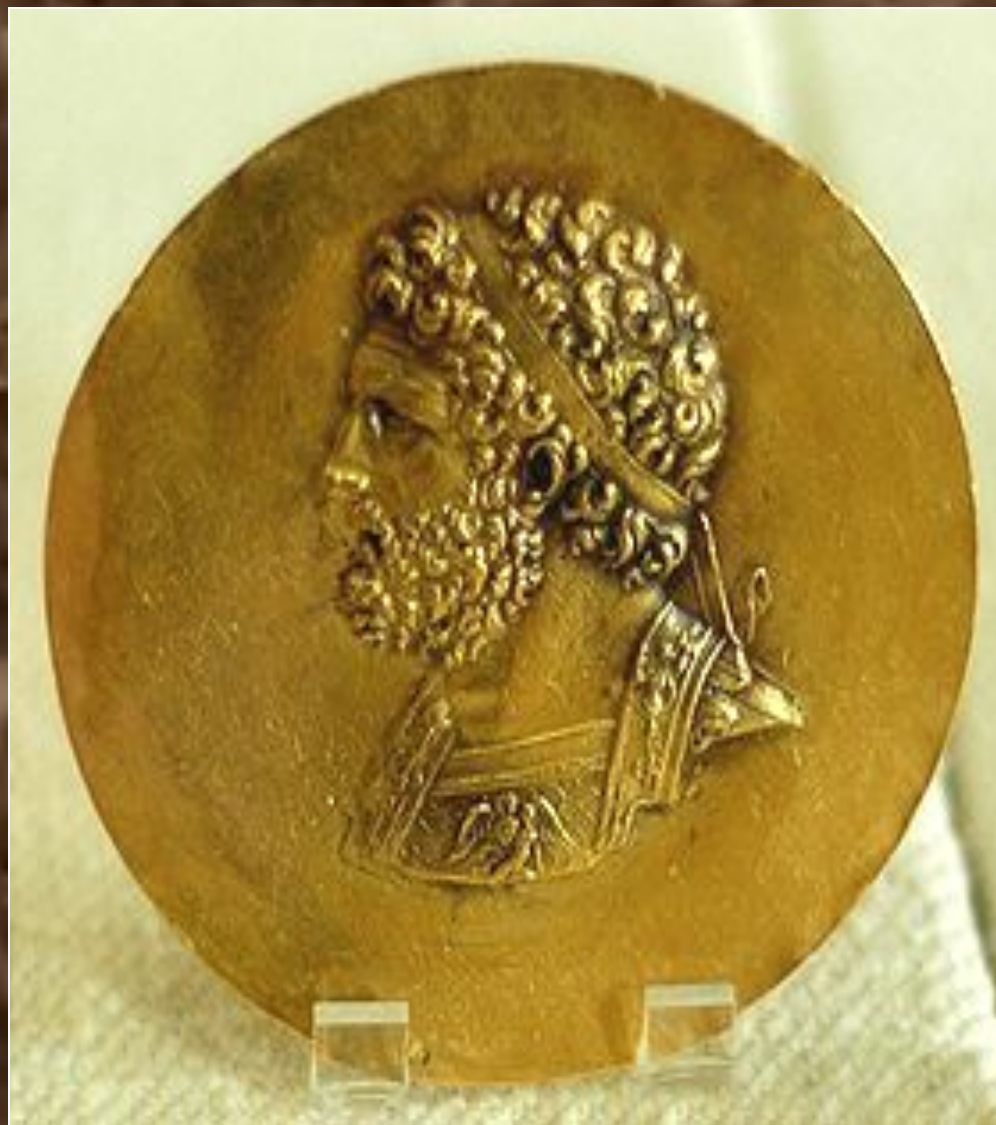
Золотой медальон с портретом Филиппа II