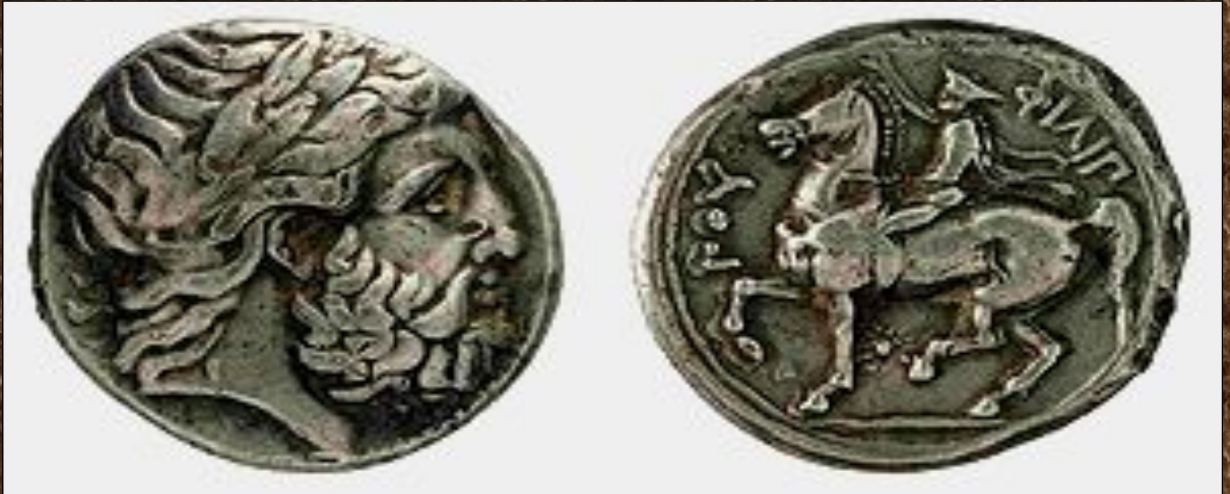
Серебряная тетрадрахма Филиппа II из музея в Фессалониках