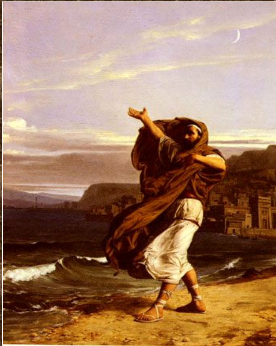
Демосфен, упражняющийся в ораторском искусстве. Художник Жан Леконт дю Нуи.