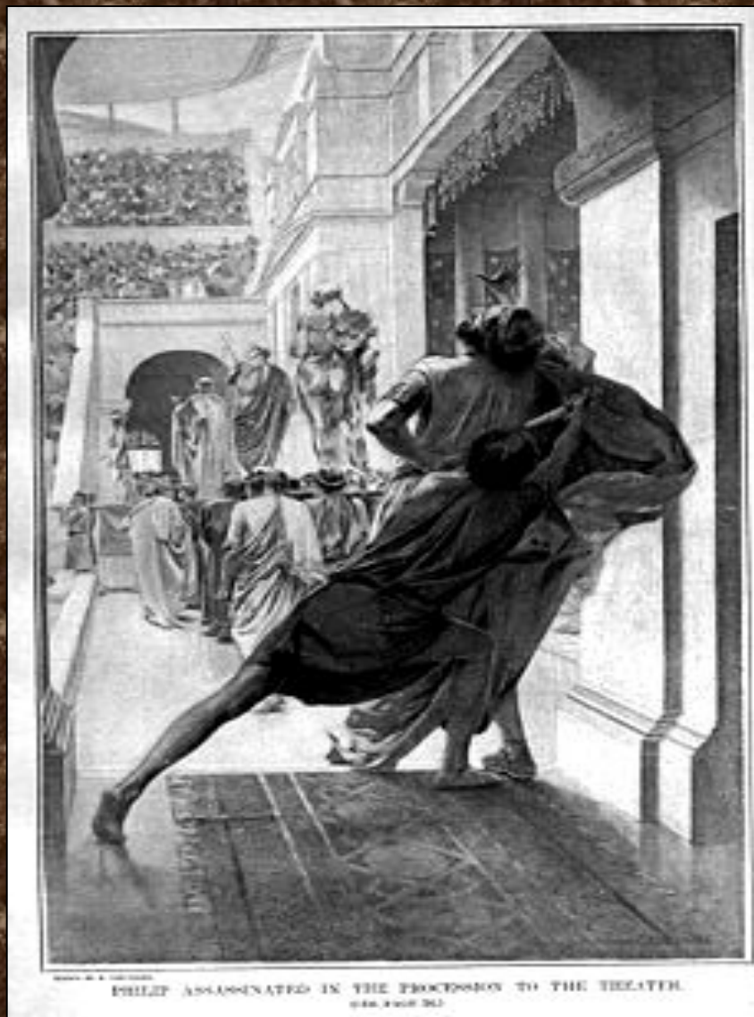
Убийство Филиппа II Павсанием. Рисунок Andre Castaigne (1899 г.).