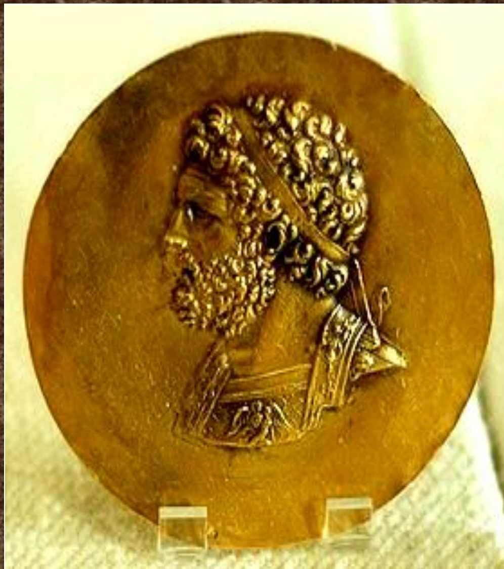
Золотой медальон с портретом Филиппа II