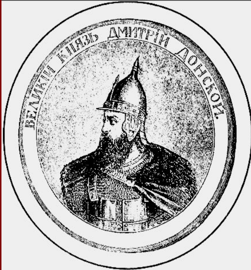
Великий князь Дмитрий. Гравюра XIX в.

В 1375 г. Дмитрий подошел к Твери и тверской князь признал себя «Молодшим братом».