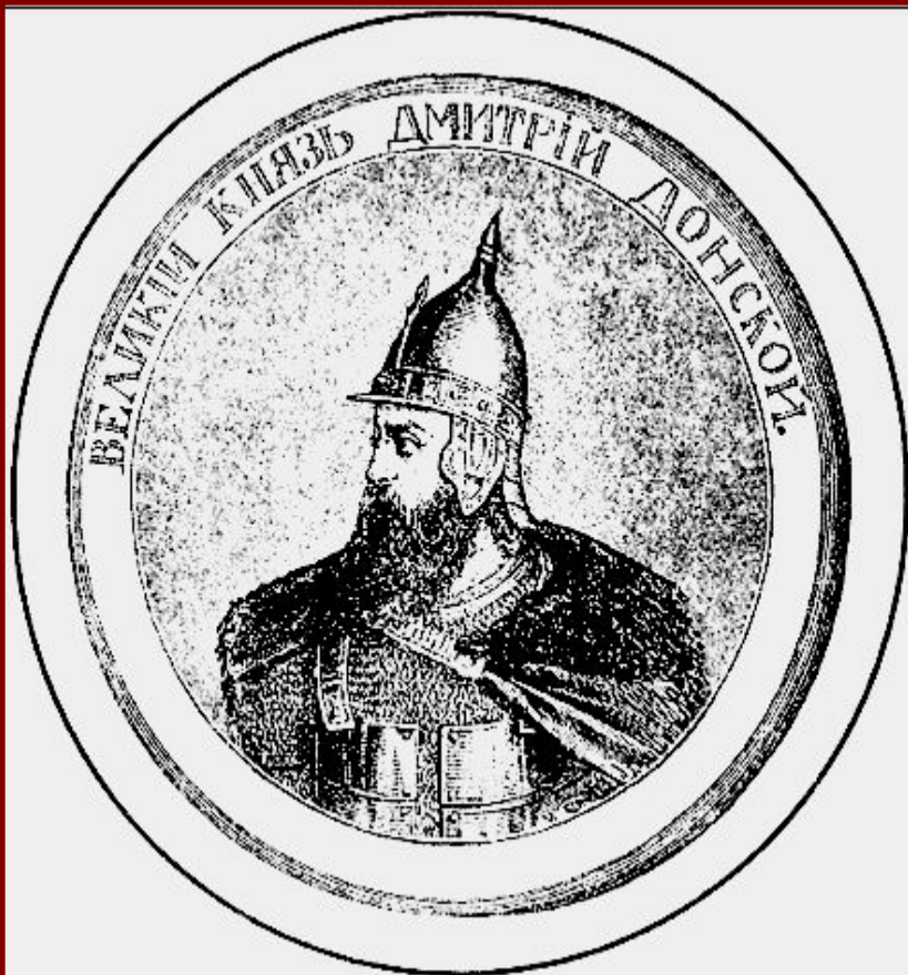
Великий князь Дмитрий. Гравюра XIX в.

В 1375 г. Дмитрий подошел к Твери и тверской князь признал себя «Молодшим братом».