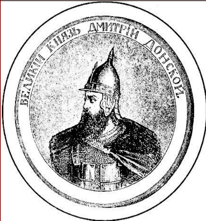
Великий князь Дмитрий. Гравюра XIX в.

В 1375 г. Дмитрий подошел к Твери и тверской князь признал себя «Молодшим братом».