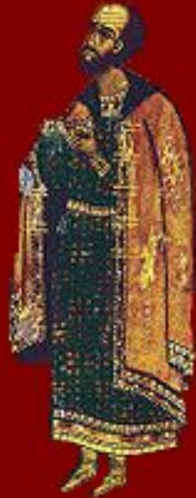
Михаил Ярославич Тверской