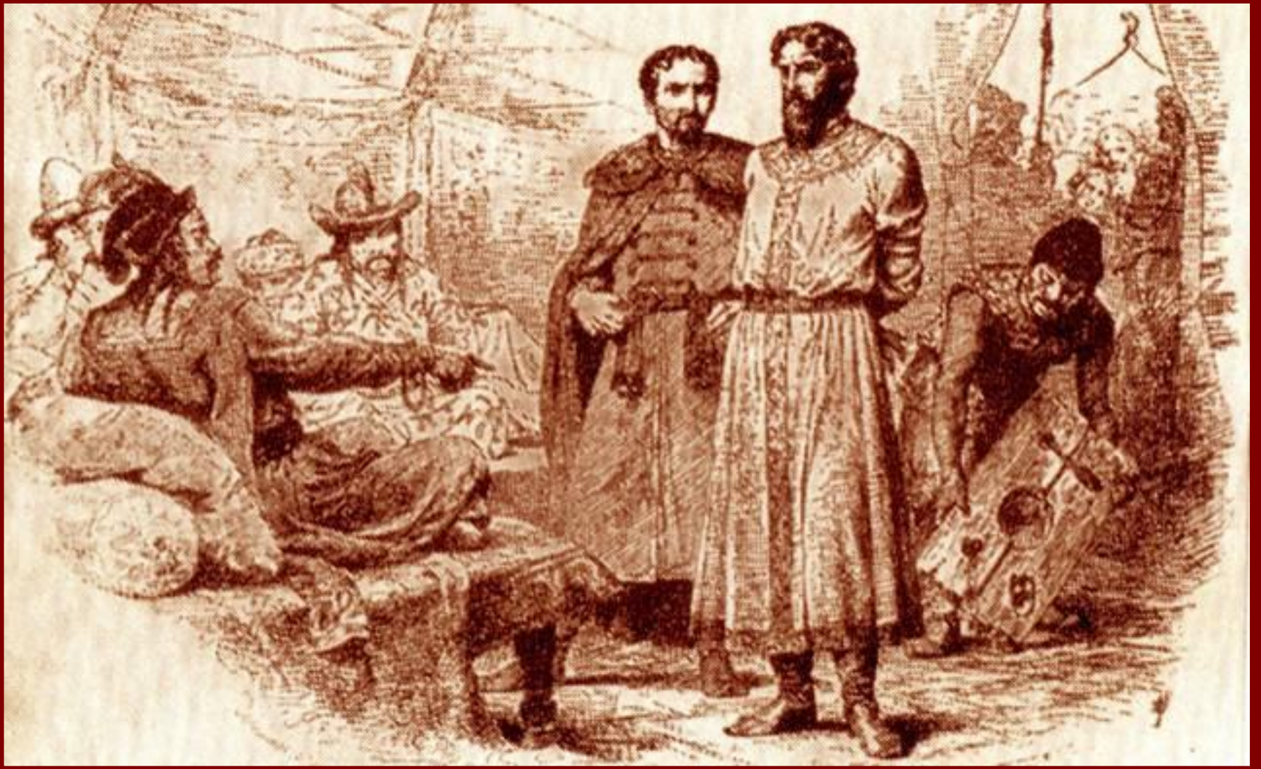
Михаил Ярославич у хана Узбека