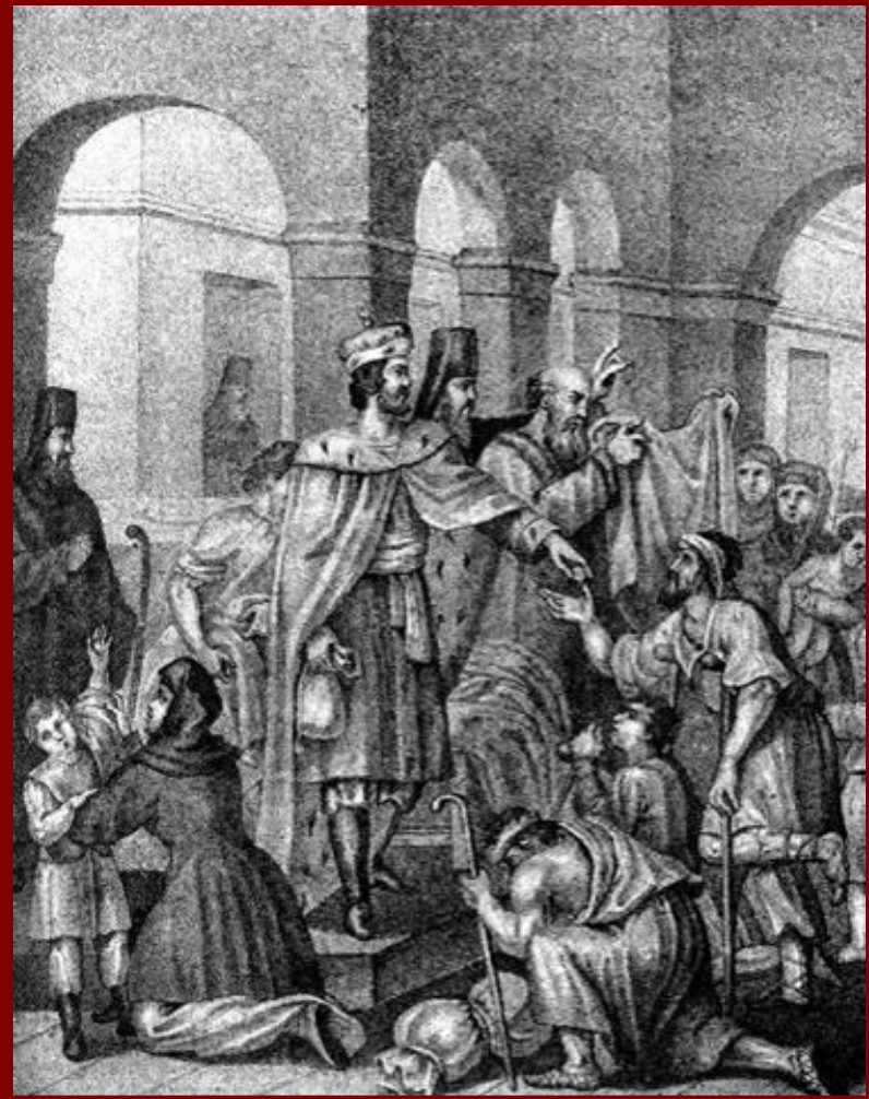
Иван Данилович Калита