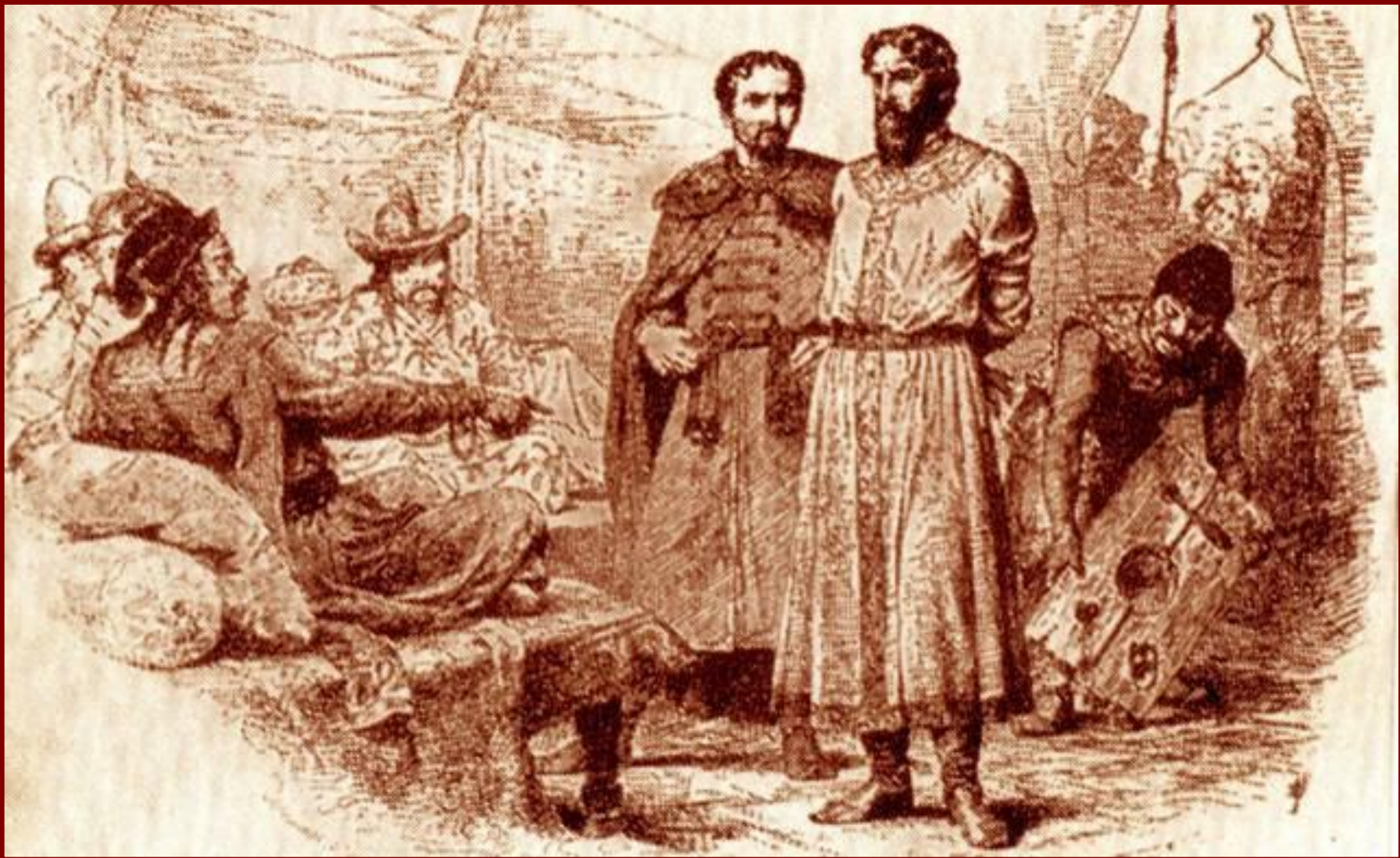
Михаил Ярославич у хана Узбека