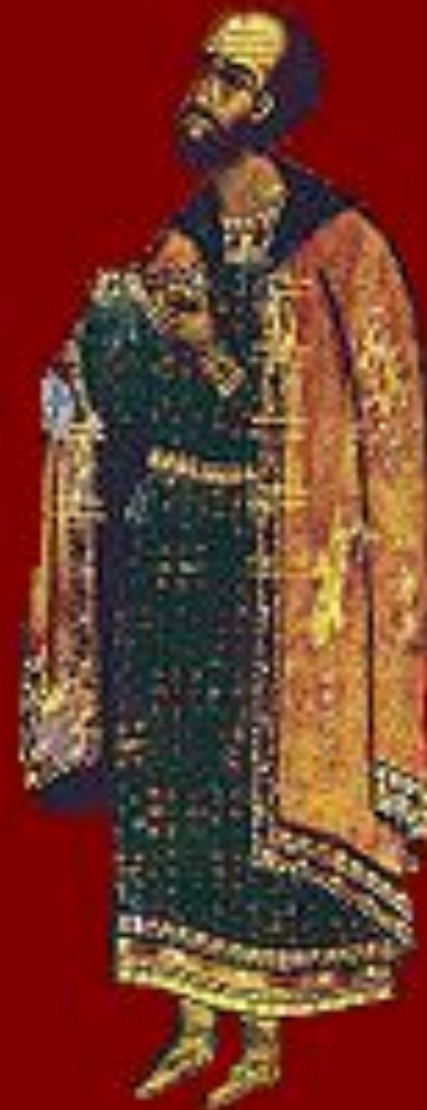
Михаил Ярославич Тверской