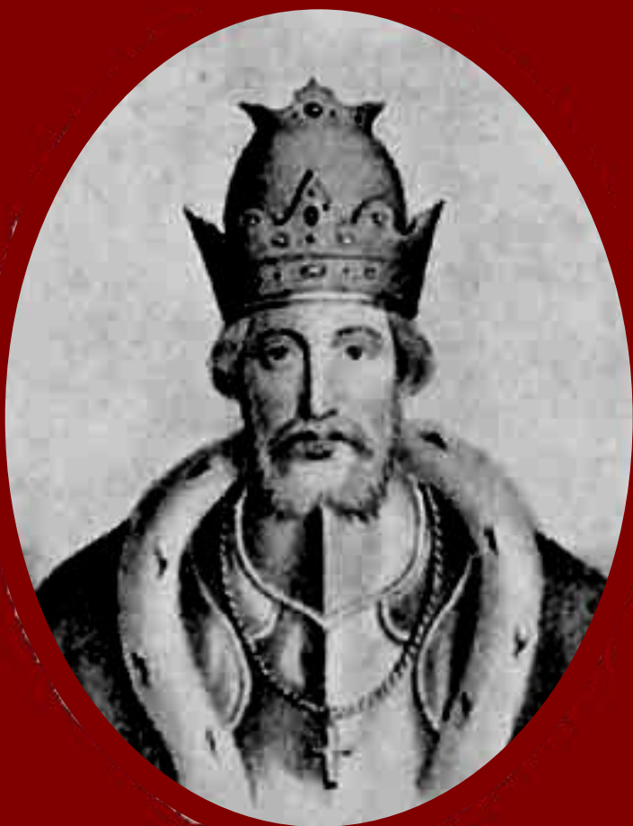
Юрий Данилович Московский