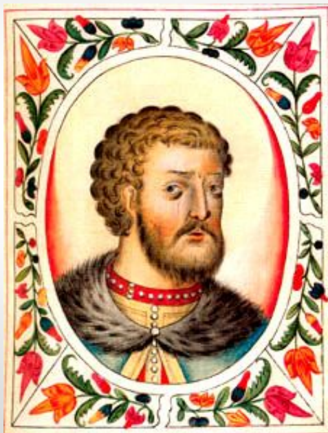
Великий князь владимирский и московский Иоанн II Иоаннович Красный

Политику Ивана Калиты по укреплению Московского княжества продолжили его сыновья - Семен Гордый и Иван II Красный. В правление этих князей прекратились опустошительны е набеги ордынцев и литовцев.