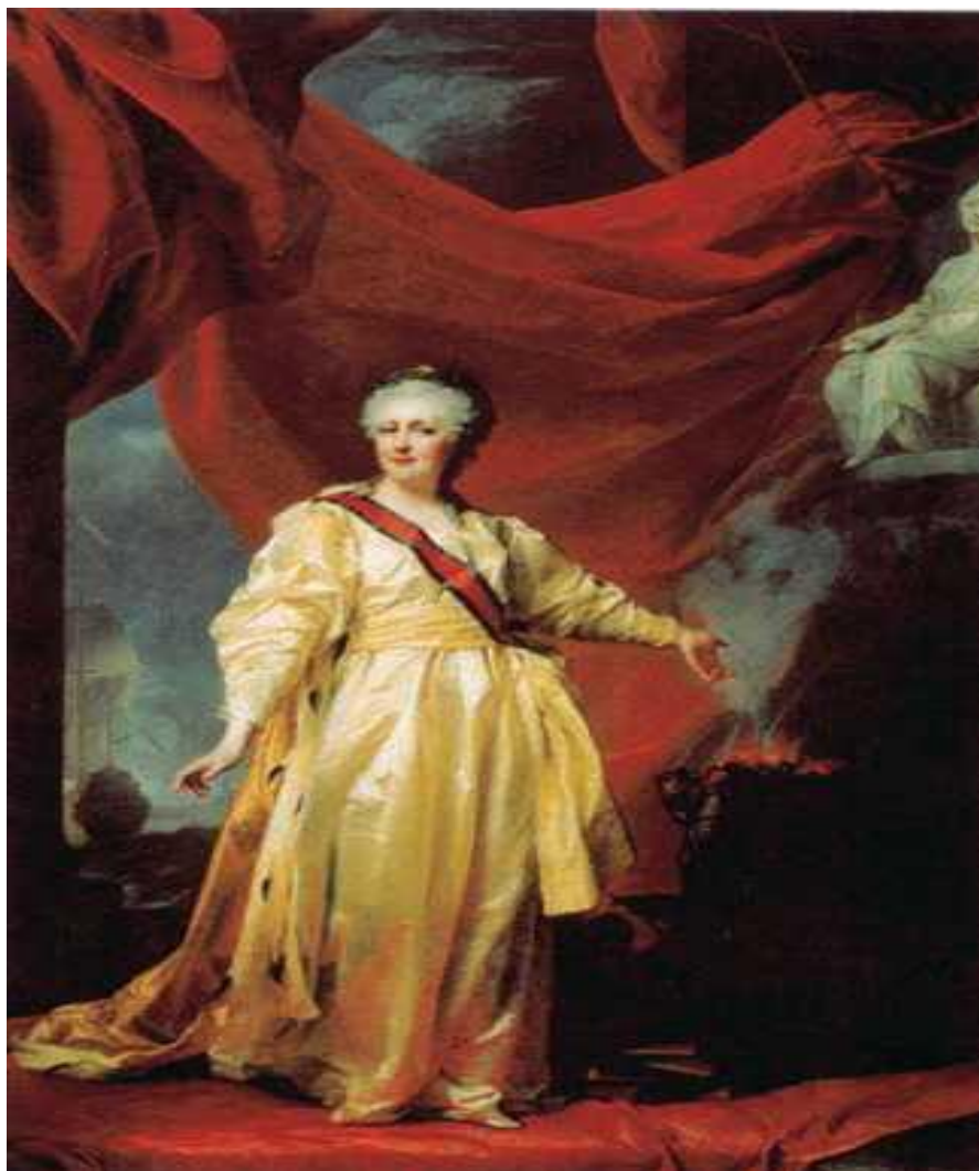
Левицкий Д. Екатерина II в виде законодательницы