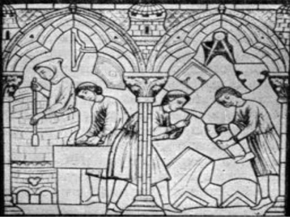
Камнетеси. Вітраж 13 ст.