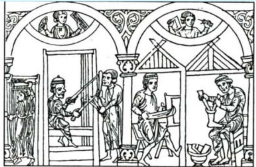
Ремесленники. Мініатюра (начало XIII в.)