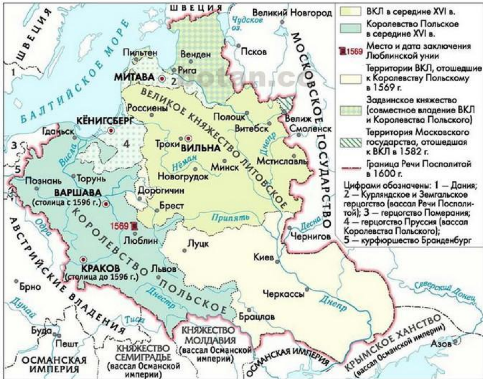
Речь Посполитая во второй половине XVI в.