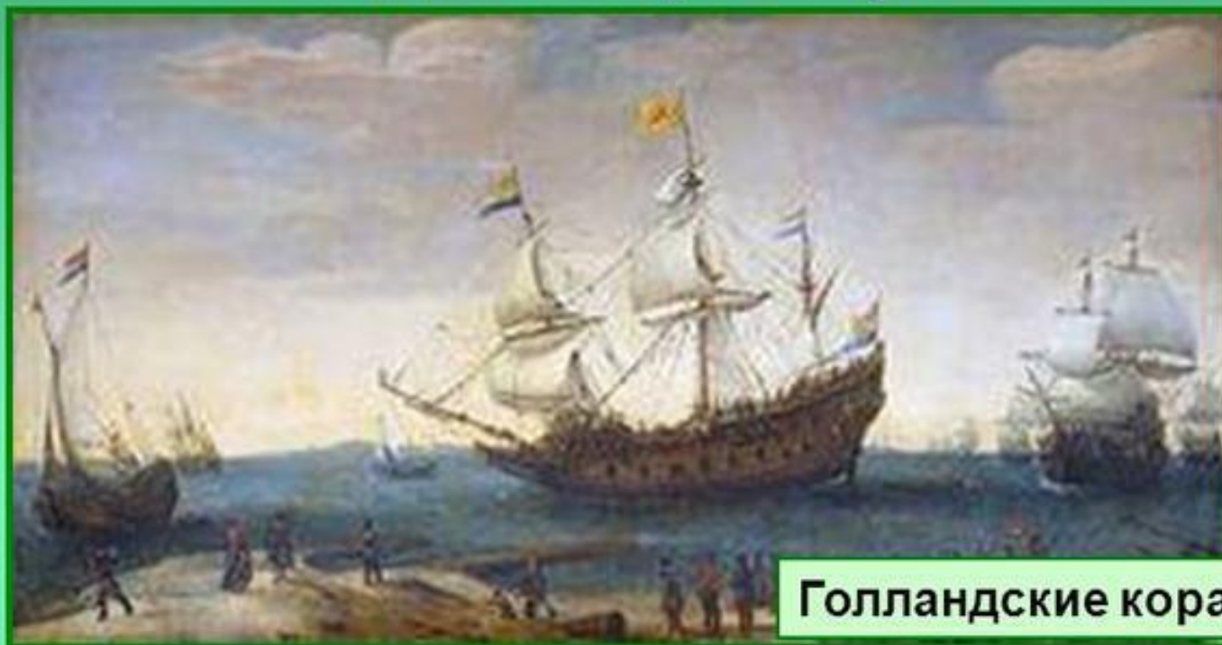
Голландские корабли 17 в.

Победа в национально-освободительной войне сделала Голландию самым развитым государством Европы, наступил расцвет промышленности.