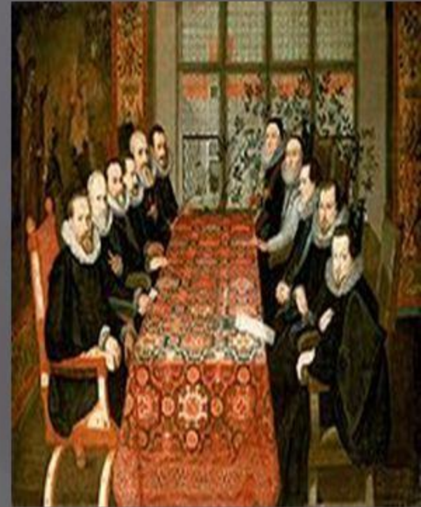
Подписание мира в Сомерсет-хаус, 1604. Справа, второй от окна — Чарлз Ховард