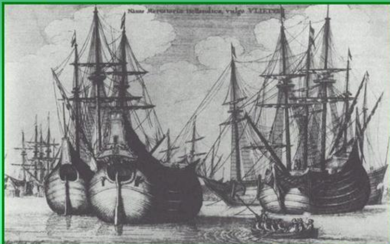
Голландские парусные транспортные суда. Эстамп В.Холлара. 1647 г.

Население Нидерландов занималось сельским хозяйством, мореходством и рыболовством. В стране процветали мануфактуры и торговля, развивалось капиталистическое предпринимательство. Нидерландские корабли были лучшими в мире.