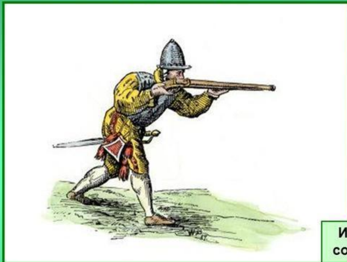
Испанский солдат 16 в.

Испанцы начали наступление против восставших провинций, жестоко карая непокорных. Филипп II был недоволен действиями Альбы в 1573 г. он был отозван. Испанские солдаты не получавшие жалованья жестоко грабили местное население.