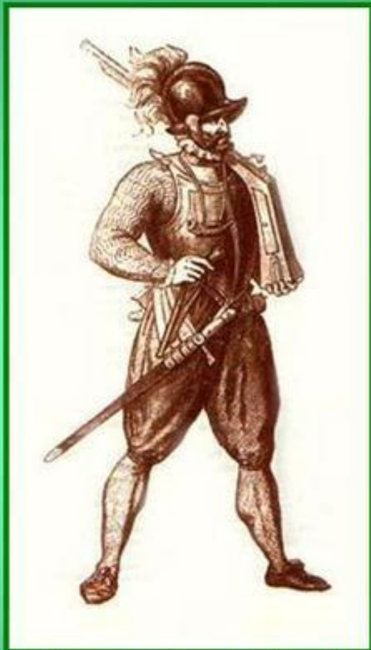
Испанский солдат 16 в.

Политика Испании приносила вред всем слоям населения Нидерландов. Недовольство политикой Габсбургов вызывало восстания городской бедноты и усиления влияния протестантизма.