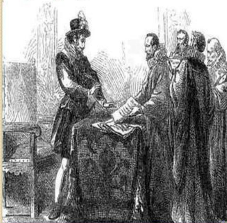
Подписание Нантского эдикта

13 апреля 1598 Генрих IV издал Нантский эдикт, который подвел итог религиозным войнам. «... Мы позволили и позволяем исповедующим ... реформированную религию жить и обитать во всех городах и местах нашего королевства... без преследований, притеснений и принуждений». Из Нантского эдикта