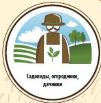
Садоводы, огородники, дачники