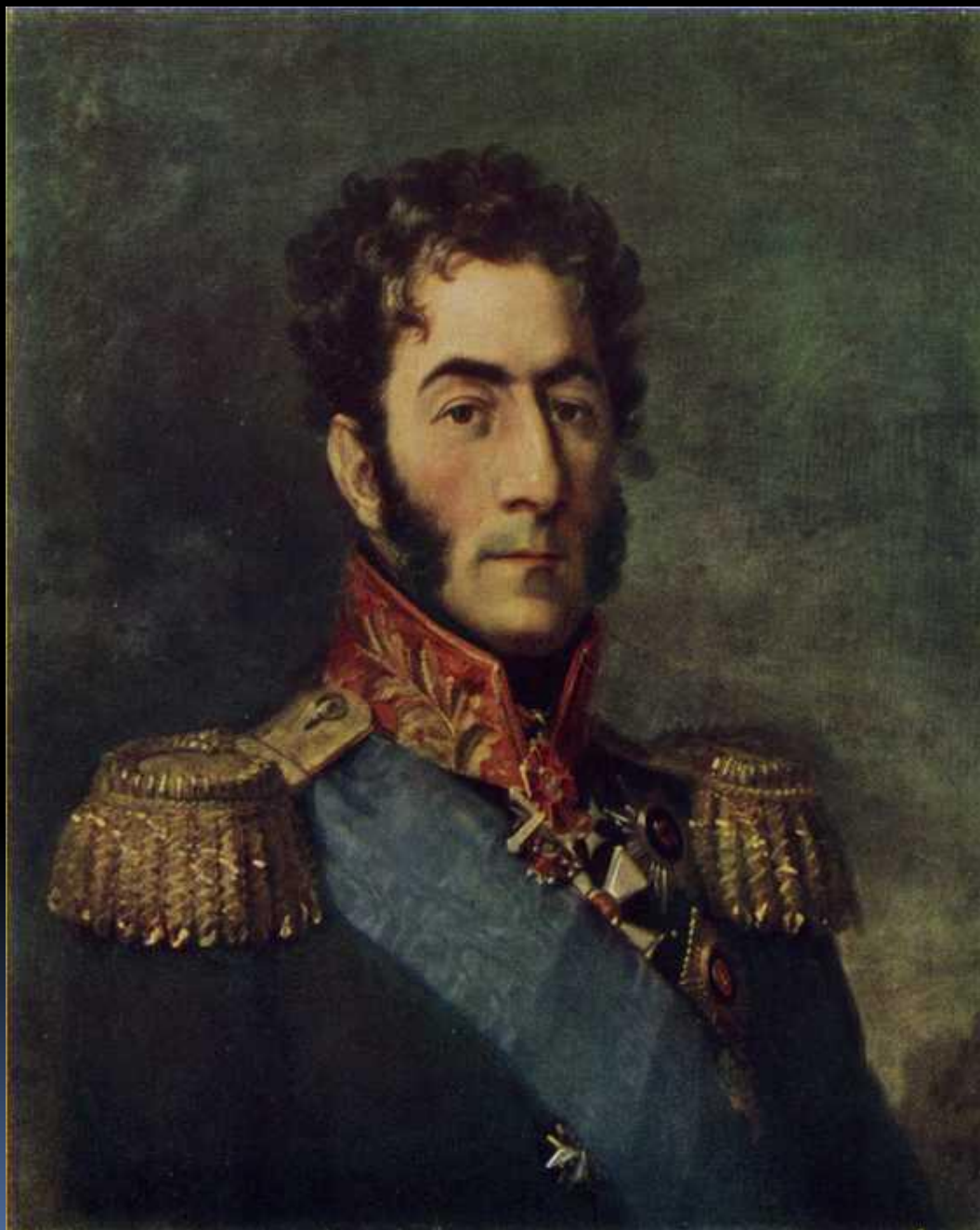
Багратион Петр Иванович (1765-1812)