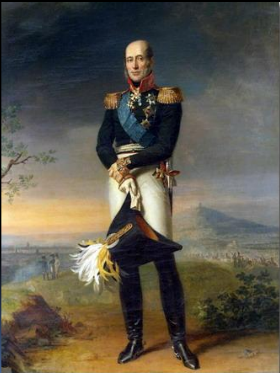
Михаил Богданович Барклай-де-Толли (1761-1818)