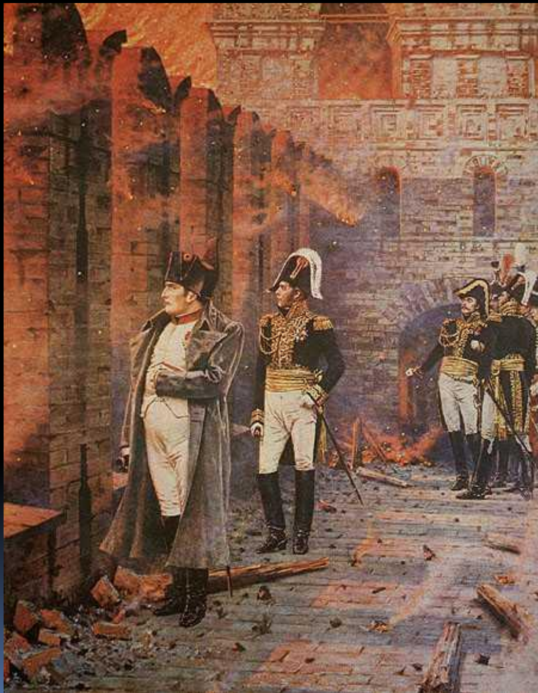
В.В. Верещагин «В Кремле - пожар!»