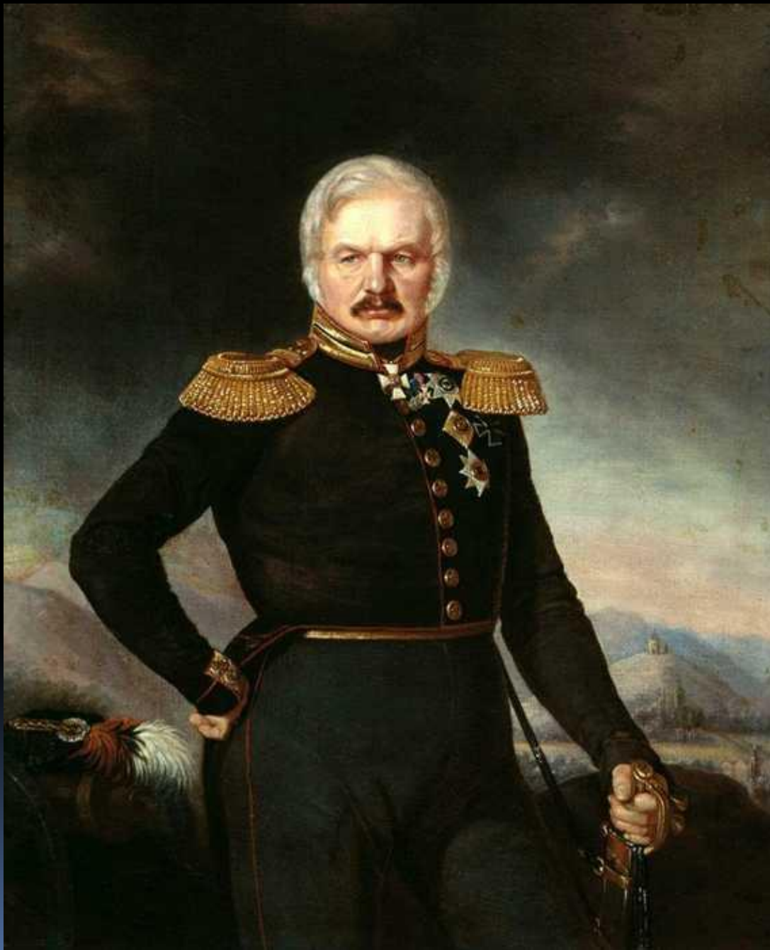
Портрет А. П. Ермолова КИСТИ П. Захарова- Чеченца, примерно 1843 год.