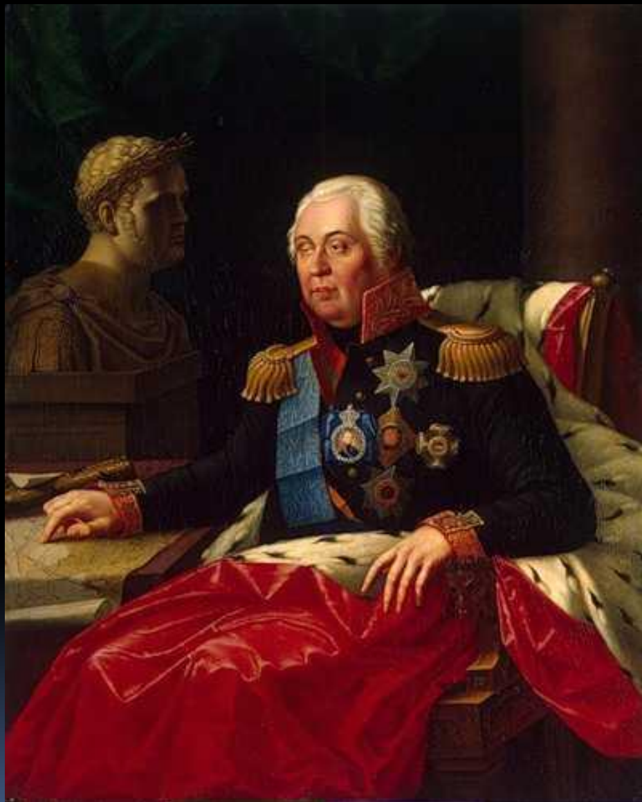
МИХАИЛ ИЛЛАРИОНОВИ Ч КУТУЗОВ (1745-1813)