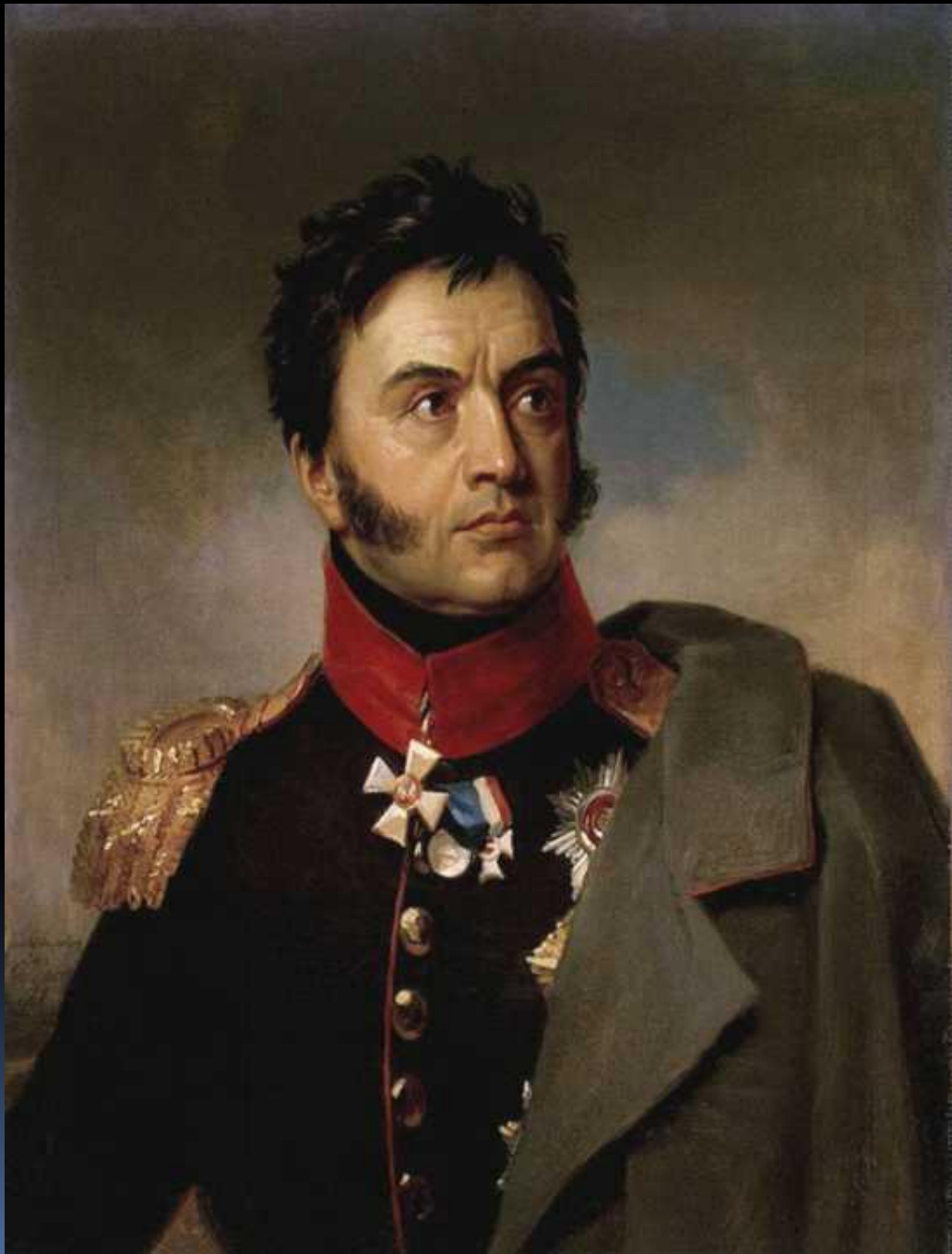
Николай Николаевич Раевский (1771-1829)