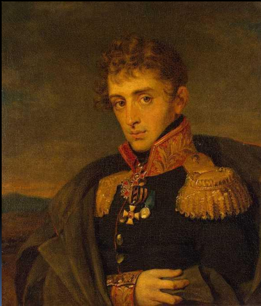
Тучков Александр Алексеевич (1777 – 1812)