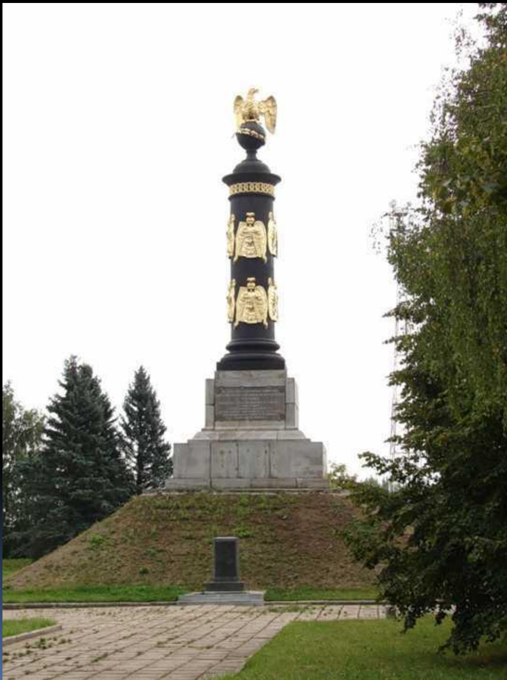
Памятник в Тарутино