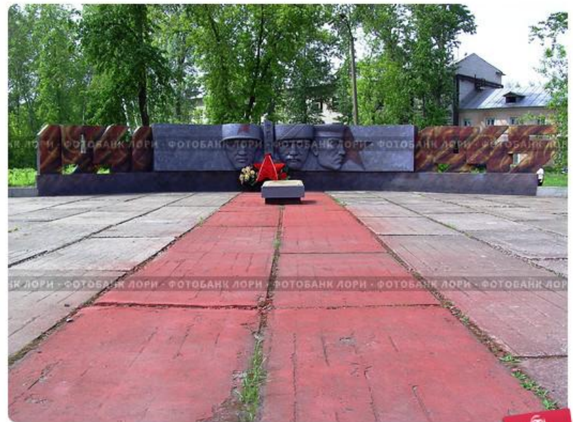
Кулебаки. Монумент героям войны