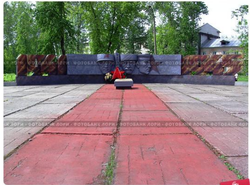
Кулебаки. Монумент героям войны