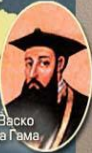
Васко да Гама