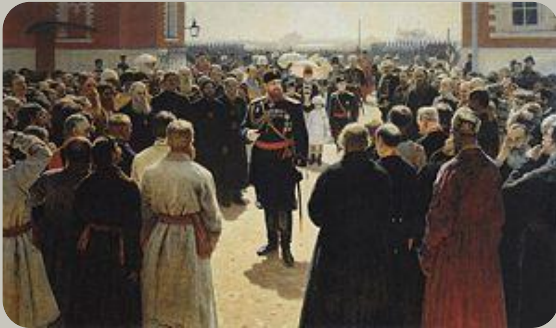
Прием волостных старшин Александром III во дворе Петровского дворца в Москве.