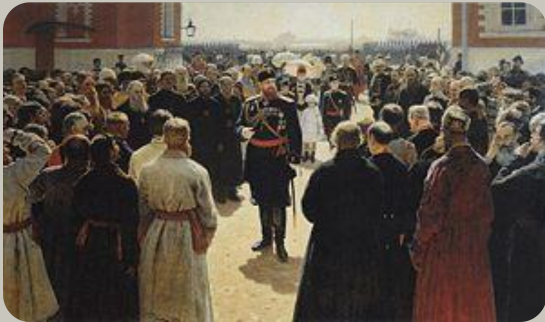
Прием волостных старшин Александром III во дворе Петровского дворца в Москве. Картина И. Репина (1885-1886)