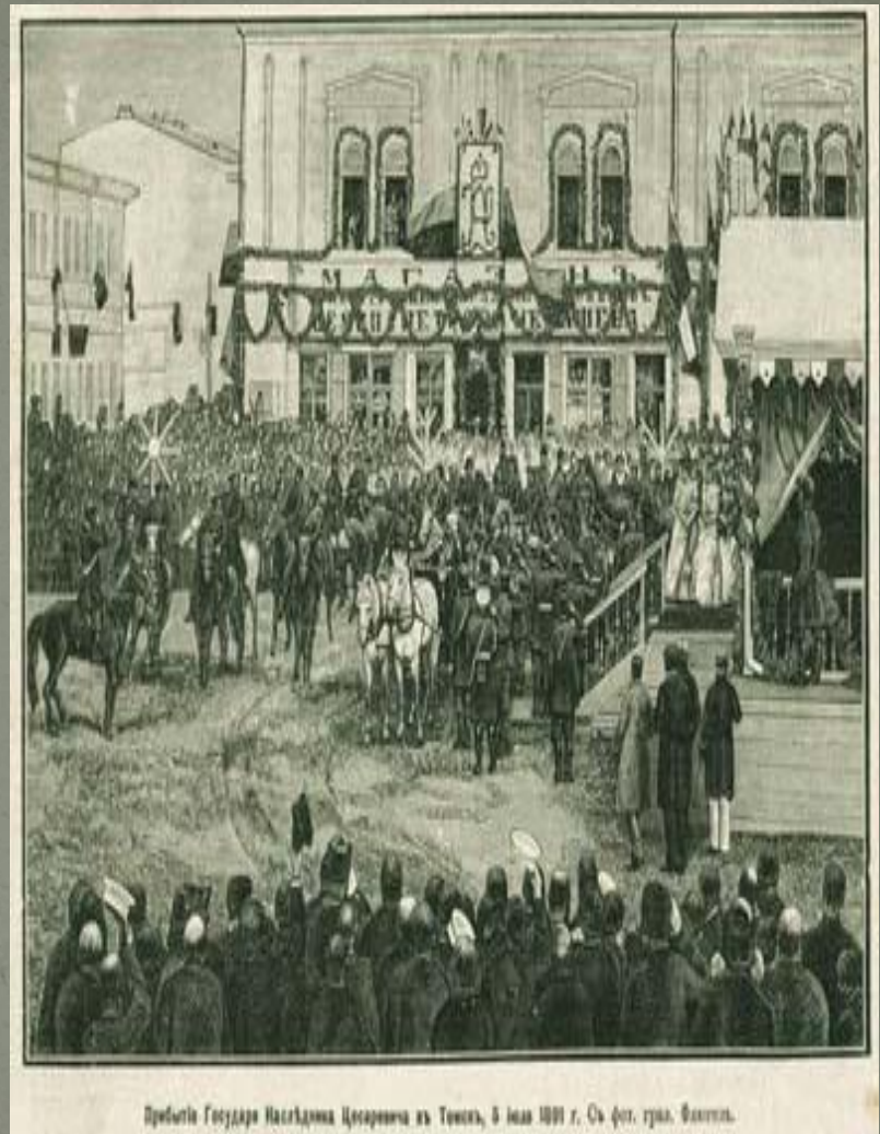
Прибытие Государя Наследника Цесаревича в Тонель, 5 июля 1801 г.

Он родился 18 октября 1705 года в Германии. В июне 1725 года Миллер получил в Лейпцигском университете степень бакалавра, а уже в ноябре он прибыл в Петербург в качестве «студента» Императорской Академии наук. Способный студент был замечен академическим начальством и его ждала стремительная карьера.