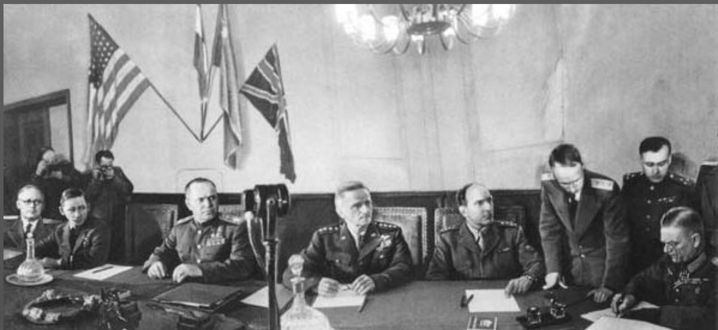
Подписание акта о капитуляции Германии.