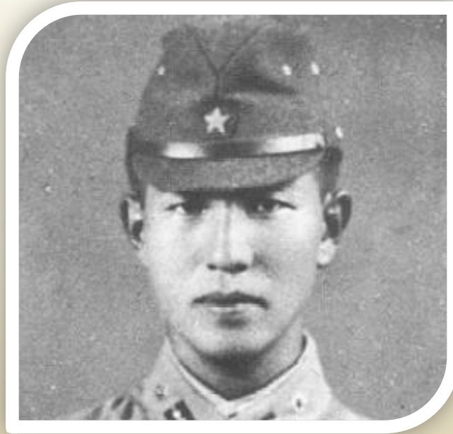
Онода Хиро, мл. лейт. Японской армии о. Лубанг

Кто и где вел партизанскую деятельность до 1974 года, не зная об окончании Второй Мировой войны?