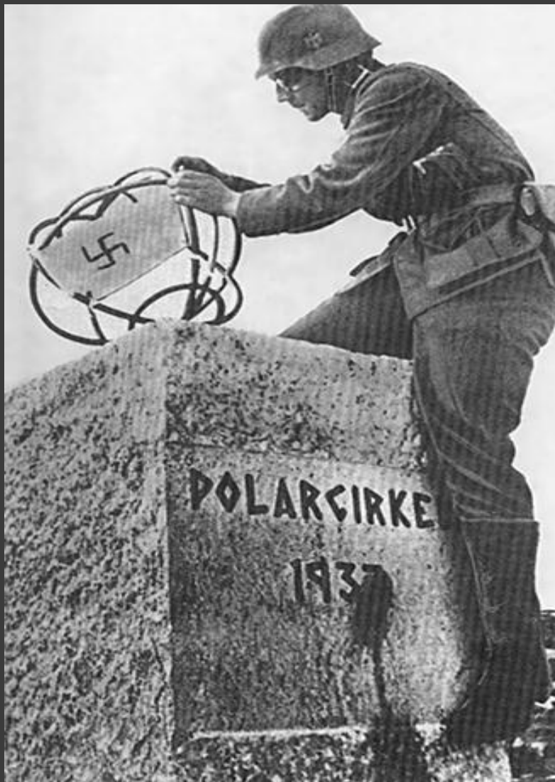
Немецкие войска в Норвегии