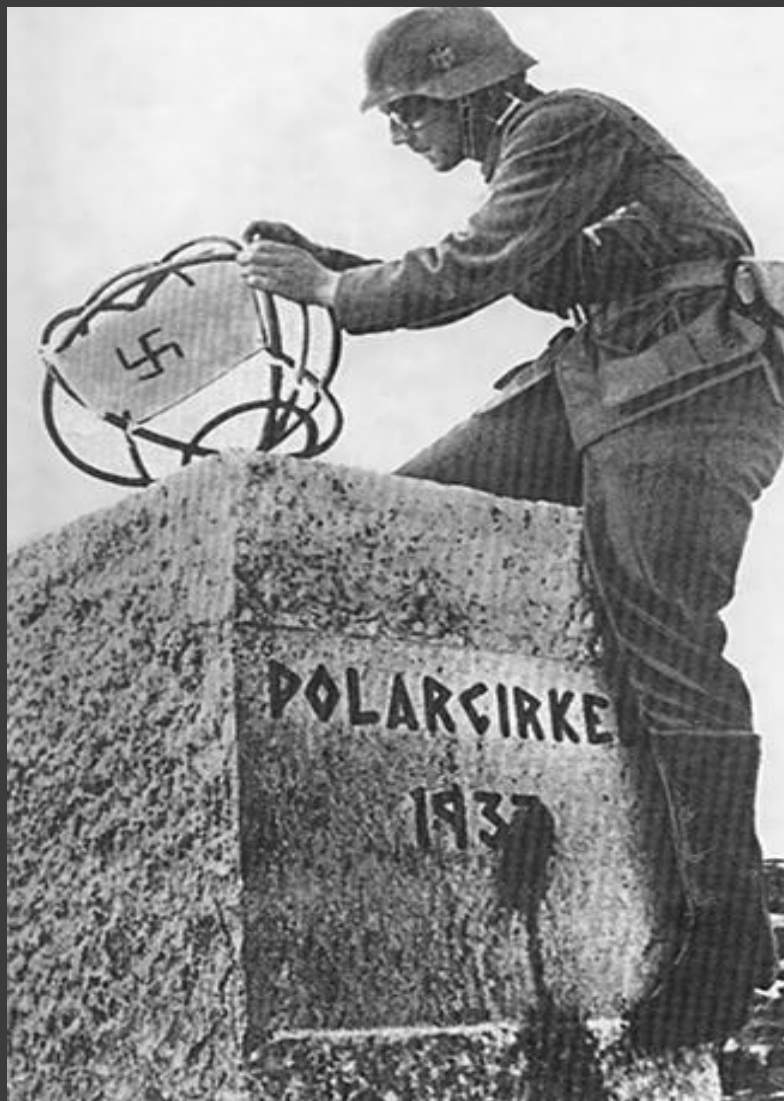
Немецкие войска в Норвегии