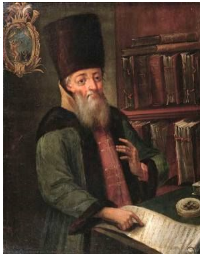
А.Л.Ордин-Нащокин (1606-1680, Псков)

С ранних лет Афанасий проявил тягу к учению, поддержанную отцом. Ордину-Нащокину посчастливилось получить хорошее образование: он знал математику, латинский и немецкий. Служебные обстоятельства заставили его познакомиться и с польским. Внимательное наблюдение над иноземными порядками и привычка сравнивать их с отечественными сделали Нащокина ревностным поклонником Западной Европы и жестоким критиком отечественного быта. После него остался ряд записок или докладов царю по разным политическим вопросам, из которых видно, что автор – говорун и бойкое перо. У него было и другое, еще более редкое качество - тонкий, цепкий и ёмкий ум. С ним было трудно спорить. Вдумчивый и находчивый, он иногда выводил из терпения иноземных дипломатов, с которыми вел переговоры: не пропустит ни малейшего промаха, сейчас подденет и поставит в тупик оплошного противника. Такое направление ума совмещалось у него с неугомонной совестью, с привычкой колоть глаза людям их несообразительностью.