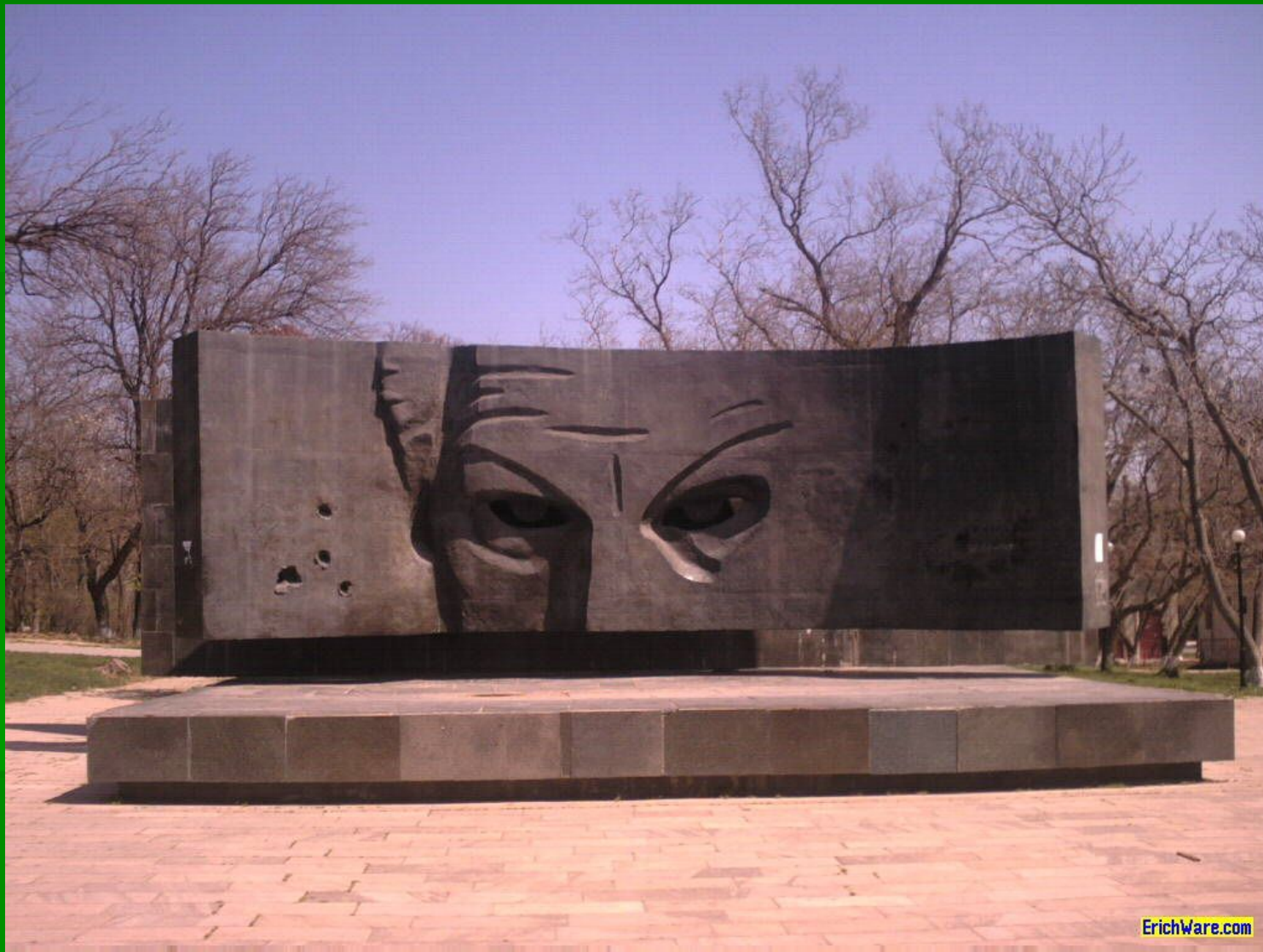
Памятник Рихарду Зорге в родном г.Баку