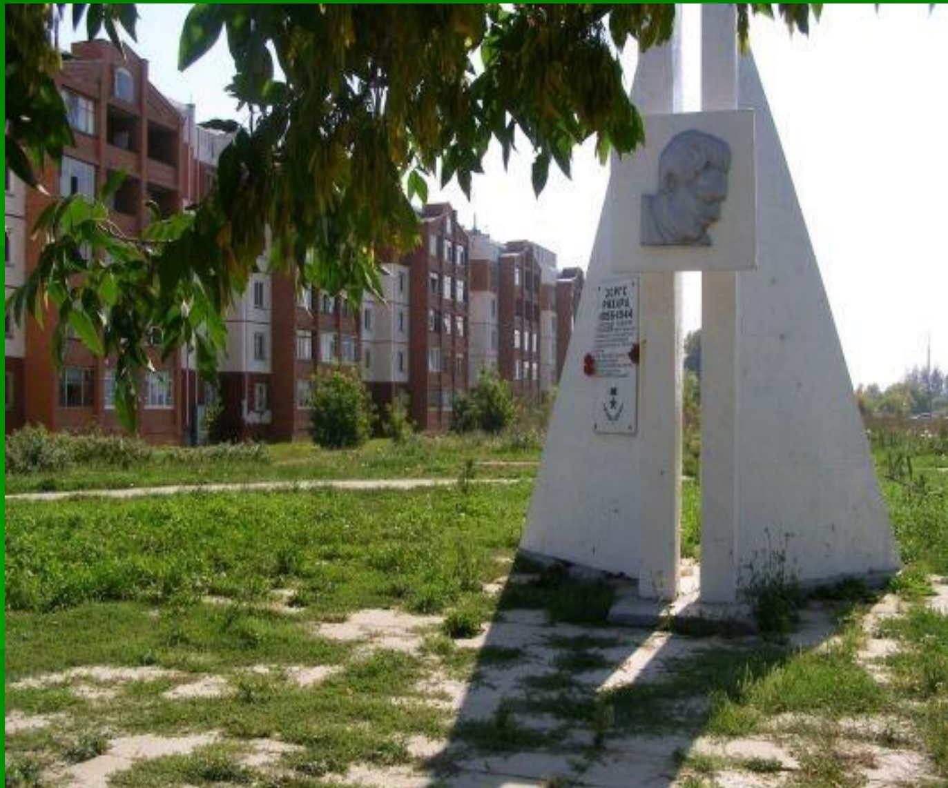
Памятник Рихарду Зорге в г. Новосибирске