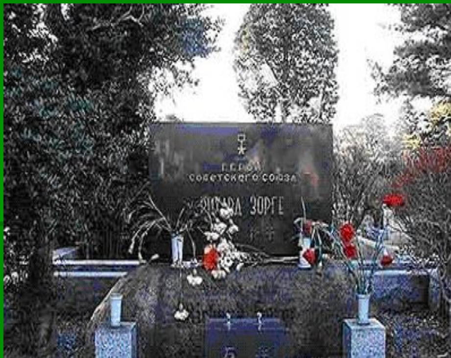
На кладбище в Токио

Похоронен во дворе тюрьмы Сугамо, а в 1967 году его останки перезахоронены на кладбище Тама в Токио