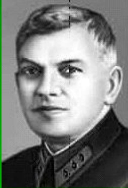
Ян Карлович Берзин