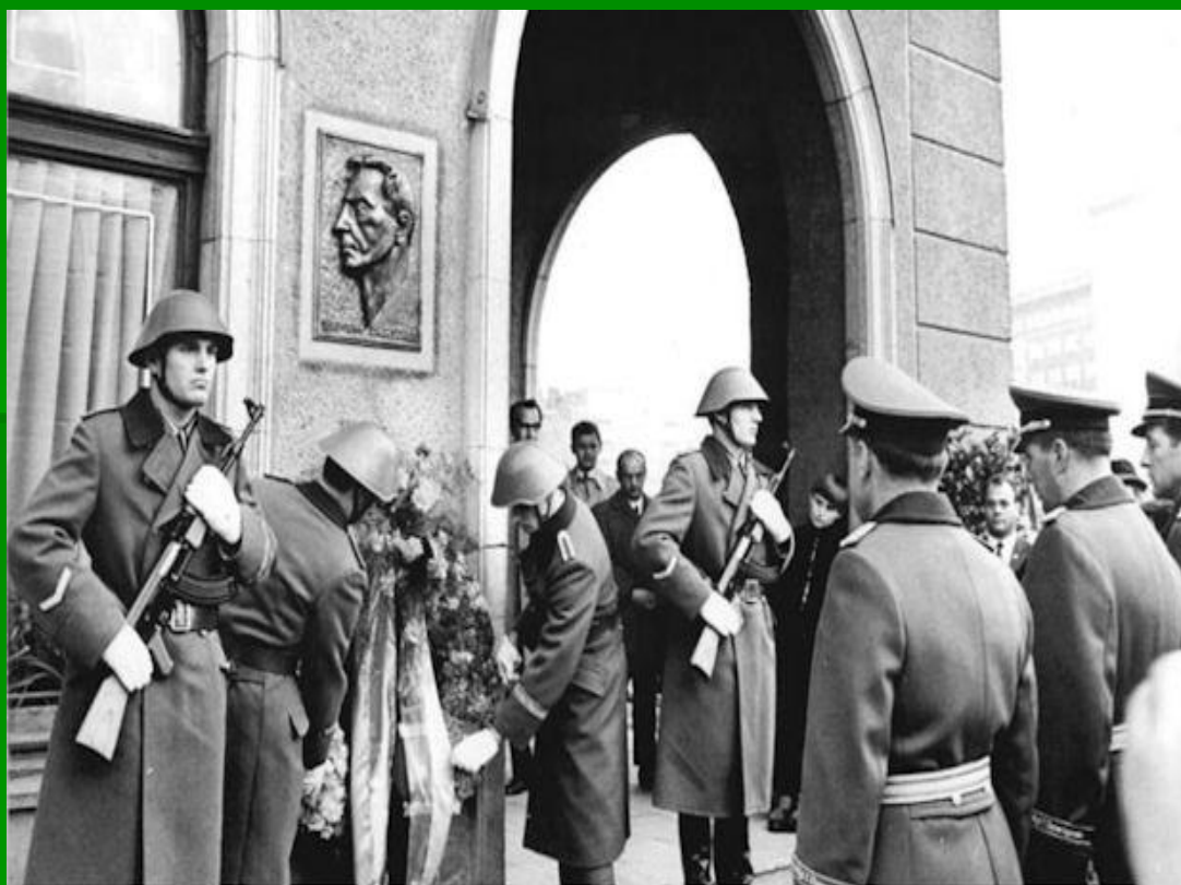
6. November 1969

Именем Зорге названы улицы во многих городах России. В Баку в его честь названы парк, одна из главных улиц. В Баку существует дом-музей Р. Зорге.