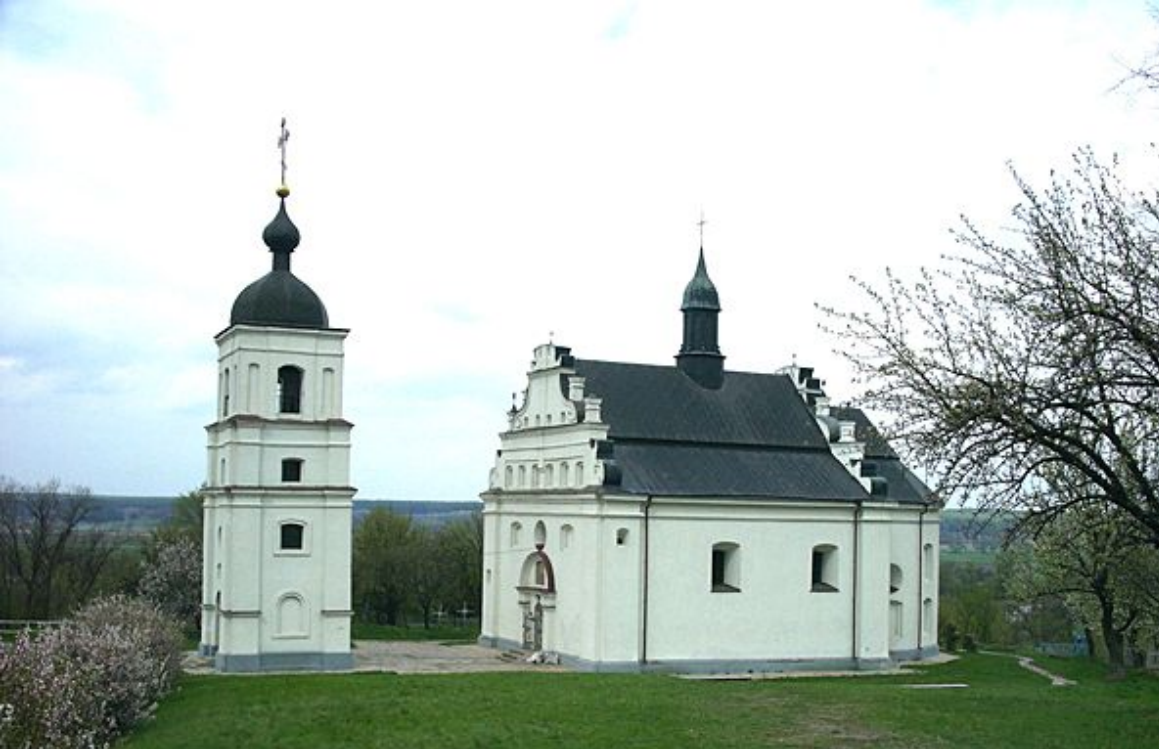
Іллінська церква в Суботіві. 1653. Реконструкція

Коли у 1657 р. Хмельницький помер, його поховали у Іллінській церкві праворуч від віттаря. Археологічні дослідження 1970-их показали, що ані труни, ані тіла Хмельницького на місці поховання вже немає, а ґрунт був неодноразово перекопаний.