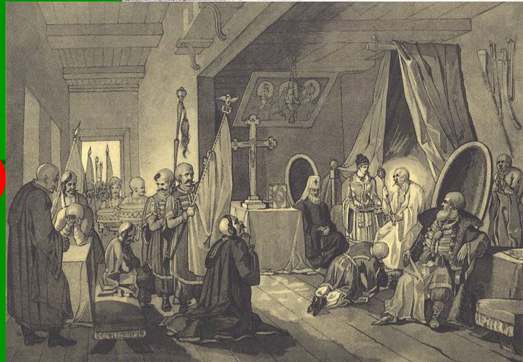
Т. Шевченко. Смерть Богдана Хмельницького

■ 27 липня (6 серпня) 1657 р. – смерть Б. Хмельницького.