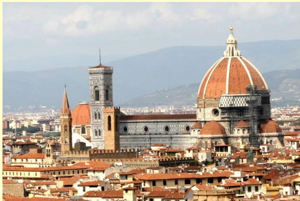
Город Флоренция. Современный вид