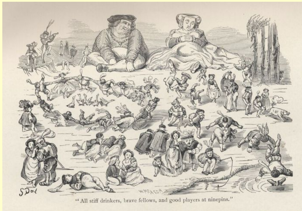
Иллюстрация к книге «Гаргантюа и Пантагрюэль»

Орудие сатиры Рабле - смех, смех исполинский, часто чудовищный, как его герои. Не удивительно, что книга Рабле вызывала такую ярость - здесь досталось всем. О королях писатель говорит устами Панурга: "Эти чертовы короли здесь у нас на земле, - сущие ослы: ничего-то они не знают, ни на что не годны, только и умеют, что причинять зло несчастным подданным..."