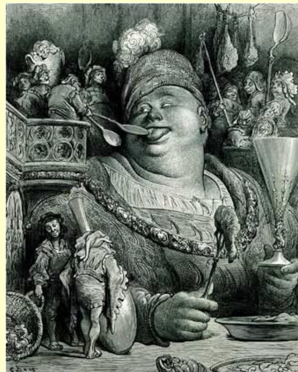
Иллюстрация к книге «Гаргантюа и Пантагрюэль»

Но больше всего нападает Рабле на монахов. Монахами он населил остров Звонкий, и единственное, чем они там занимаются, — это бьют поклоны да звонят в колокола. "Монах не пашет землю в отличие от крестьянина, не охраняет отечество в отличие от воина, не лечит больных в отличие от врача... монахи только терзают слух окрестных жителей дилим-бомканьем своих колоколов" .