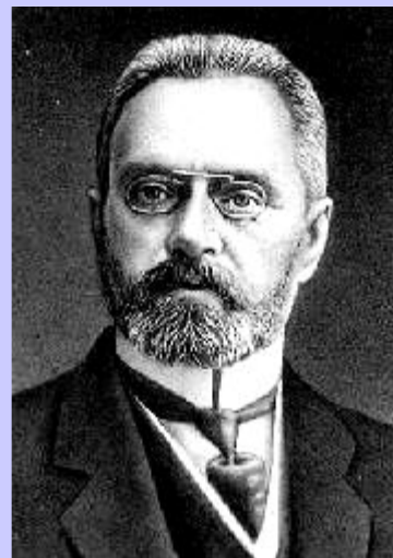
П.Н.Миллюков и А.И.Гучков

Кадеты опирались в основном на интеллигенцию. В это же время возник «Союз 17 октября» (А.И.Гучков). Октябристы добивались единства России, неприкосновенности частной собственности, уравнивания крестьян в правах с др. сословиями, наделение их участками за счет продажи государственных земель, ограничение стачек и введение рабочего законодательства. Октябристы опирались на крупную буржуазию и поме-