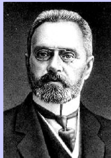
П.Н.Миллюков и А.И.Гучков

Кадеты опирались в основном на интеллигенцию. В это же время возник «Союз 17 октября» (А.И.Гучков). Октябристы добивались единства России, неприкосновенности частной собственности, уравнивания крестьян в правах с др. сословиями, наделение их участками за счет продажи государственных земель, ограничение стачек и введение рабочего законодательства. Октябристы опирались на крупную буржуазию и поме-