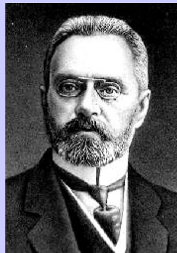
П.Н.Миллюков и А.И.Гучков

Кадеты опирались в основном на интеллигенцию. В это же время возник «Союз 17 октября» (А.И.Гучков). Октябристы добивались единства России, неприкосновенности частной собственности, уравнивания крестьян в правах с др. сословиями, наделение их участками за счет продажи государственных земель, ограничение стачек и введение рабочего законодательства. Октябристы опирались на крупную буржуазию и поме-