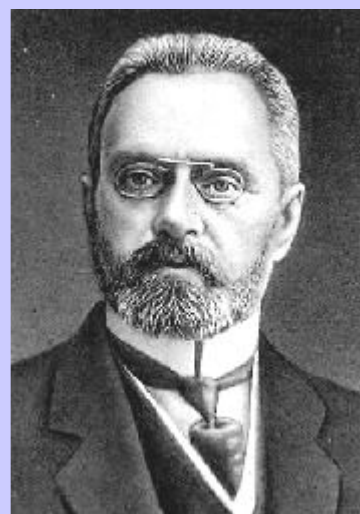
П.Н.Миллюков и А.И.Гучков

Кадеты опирались в основном на интеллигенцию. В это же время возник «Союз 17 октября» (А.И.Гучков). Октябристы добивались единства России, неприкосновенности частной собственности, уравнивания крестьян в правах с др. сословиями, наделение их участками за счет продажи государственных земель, ограничение стачек и введение рабочего законодательства. Октябристы опирались на крупную буржуазию и поме-