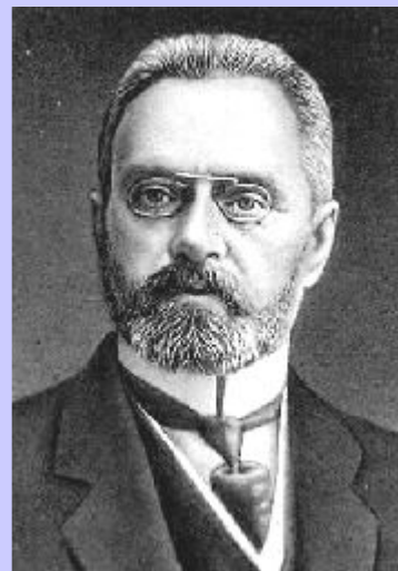
П.Н.Миллюков и А.И.Гучков

Кадеты опирались в основном на интеллигенцию. В это же время возник «Союз 17 октября» (А.И.Гучков). Октябристы добивались единства России, неприкосновенности частной собственности, уравнивания крестьян в правах с др. сословиями, наделение их участками за счет продажи государственных земель, ограничение стачек и введение рабочего законодательства. Октябристы опирались на крупную буржуазию и поме-