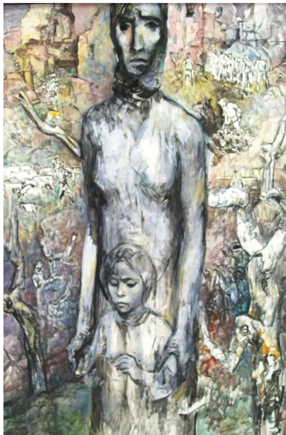
Худ. Николаев Я.С. «На оккупированной территории»