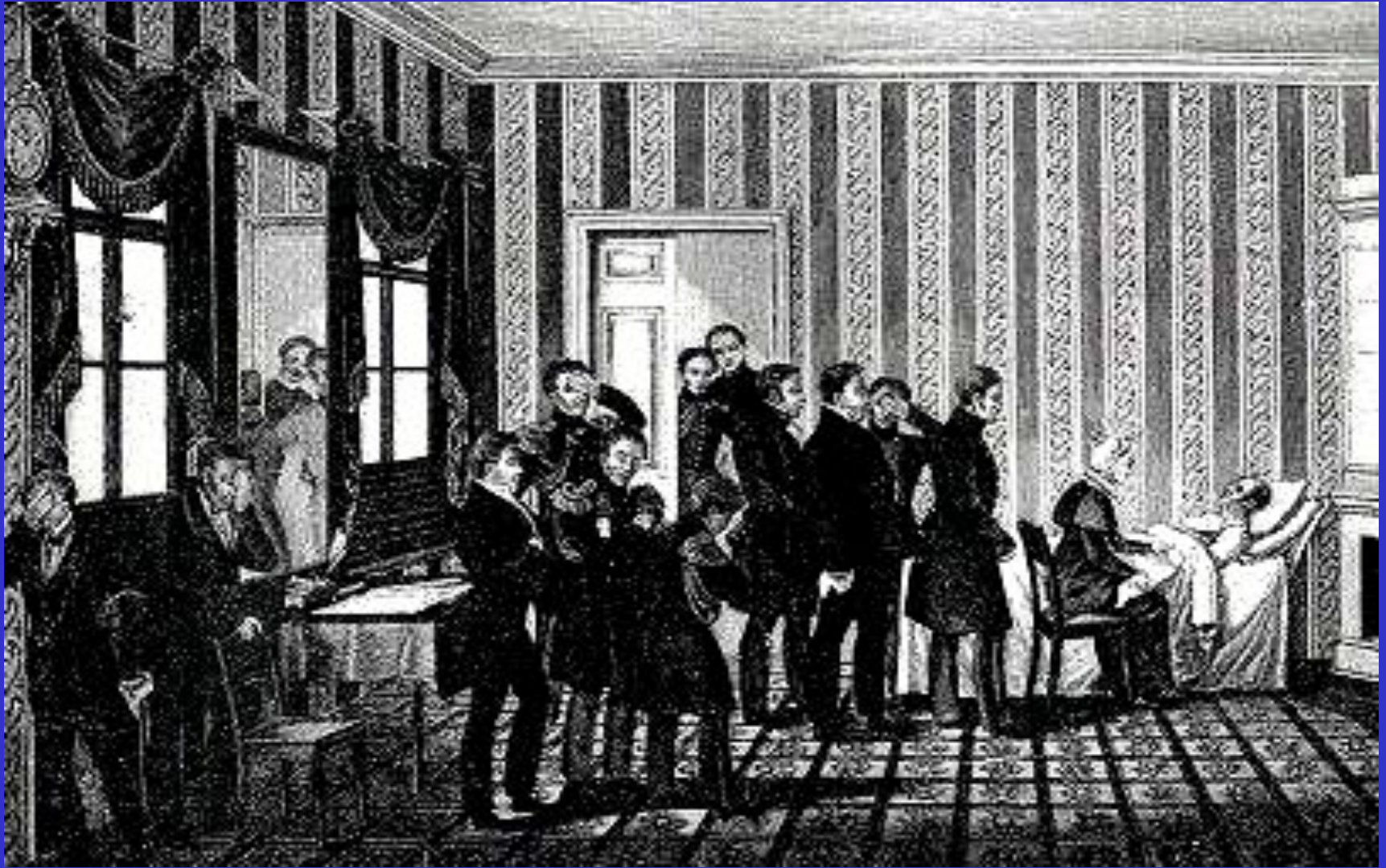
Кончина Александра I.