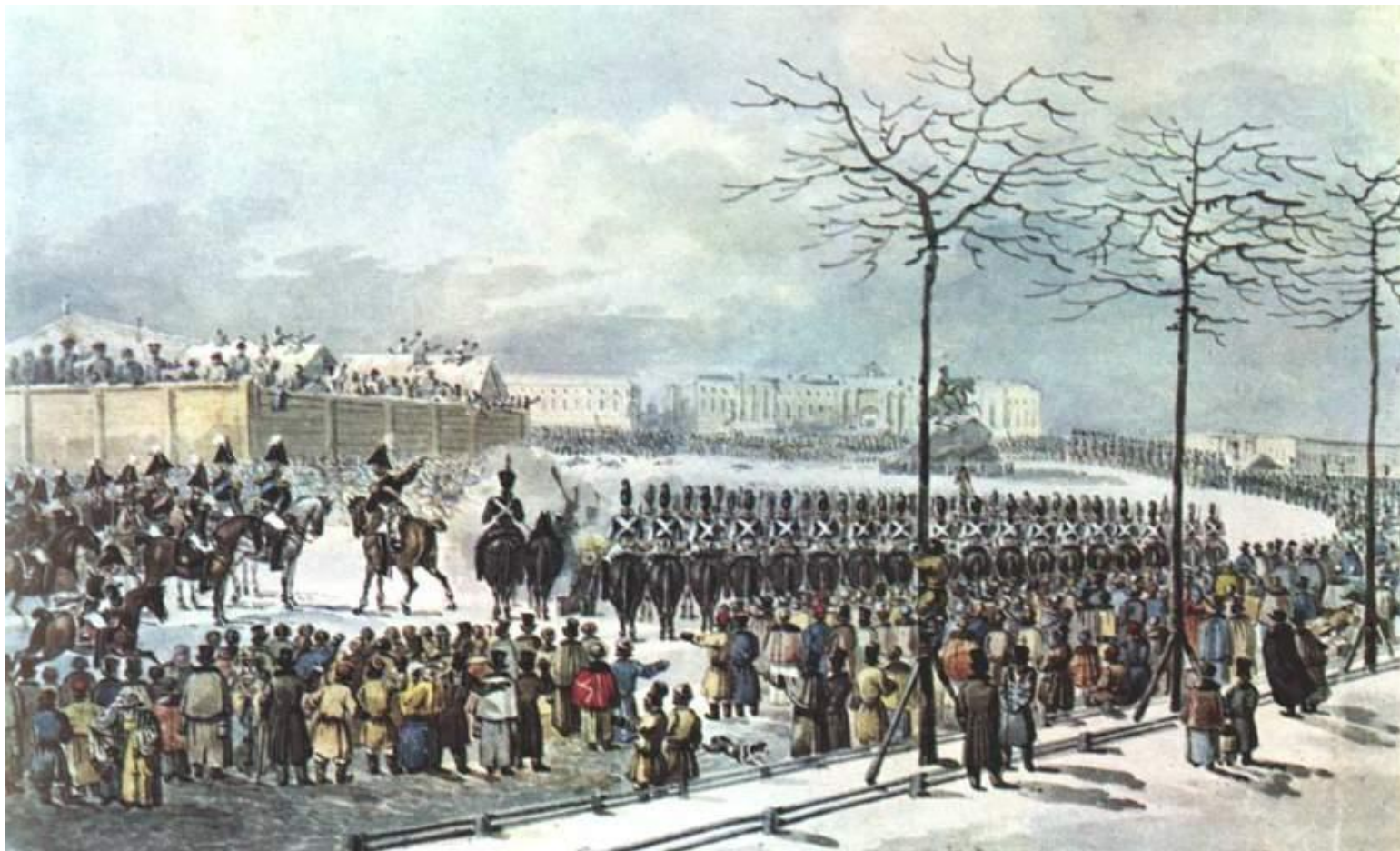
Восстание на Сенатской площади 14 декабря 1825 г. С картины К.И. Кольмана

Рано утром 14 декабря 1825 г. декабристы вывели на Сенатскую площадь Московский полк (Н.Бестужев и Дм. Ростовский-Шепин) и Гвардейский Морской экипаж (С.Булатов). Солдаты и моряки не знали истинной причины восстания. Площадь была оцеплена правительственными войсками.