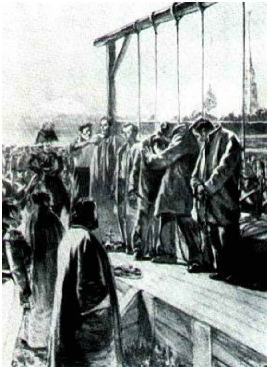
Д.Кардовский Казнь декабристов

10 (22) июля 1826 Николай I смягчил приговор для декабристов, сохранив смертную казнь через повешение только для главных «зачинщиков»: